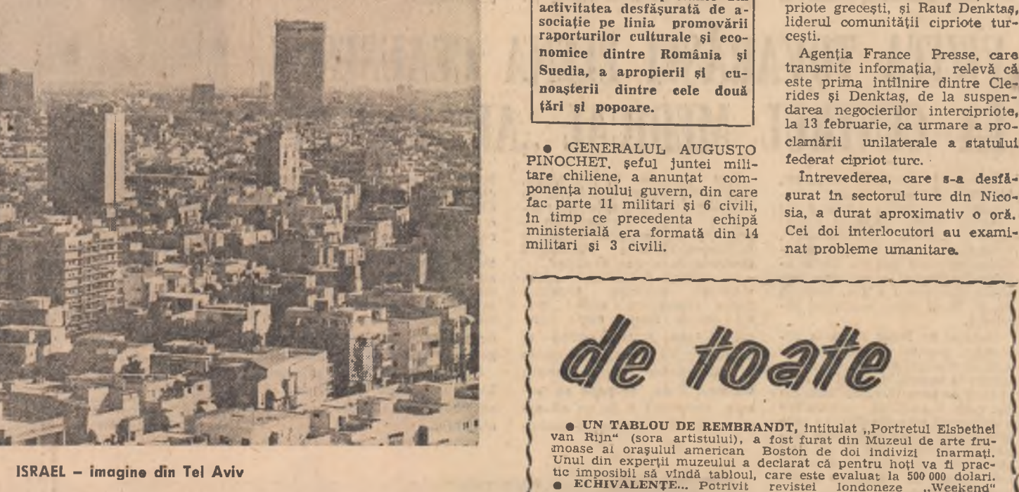
ISRAEL — imagine din Tel Aviv