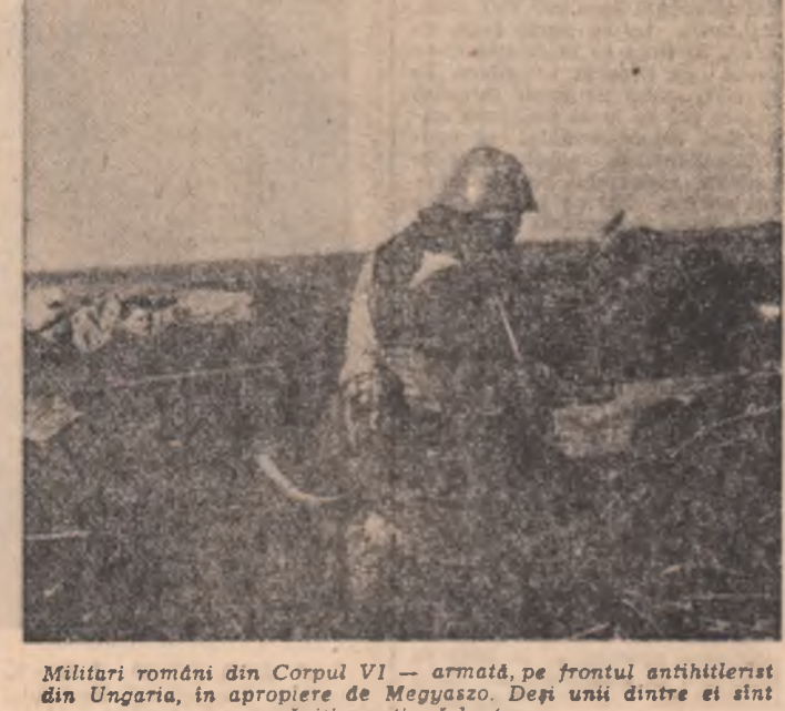
Militari români din Corpul VI — armată, pe frontul antihitlerist din Ungaria, în apropiere de Mezősas. Deși unii dintre ei sînt răniți, continuă lupta.