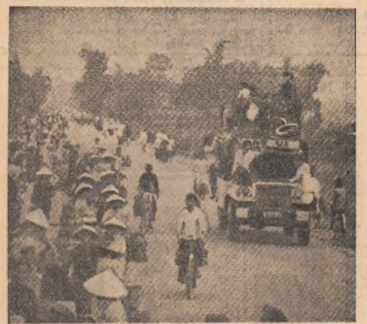
Locuitorii orașului Hue întorcîndu-se la căminele lor după eliberarea localității de către forțele patrioțice

pra localității. In luptele pentru acest oraș au fost nimicite divizia a 18-a saigoneză și o importantă parte a corpului 3 de tancuri inamic. Totodată, trupele inamice care apărau Saigonul din direcțiile est și nord-est au fost silit să se retragă cu mari pierderi în zona bazei aeriene de la Bien Hoa, situată la mai puțin de 30 de kilometri de Saigon și supusă recent unor repetate și violente bombardamente cu proiectile de artilerie grea. De asemenea, forțele de eliberare au bombardat poziții inamice în sud-vestul și nord-vestul Saigonului.