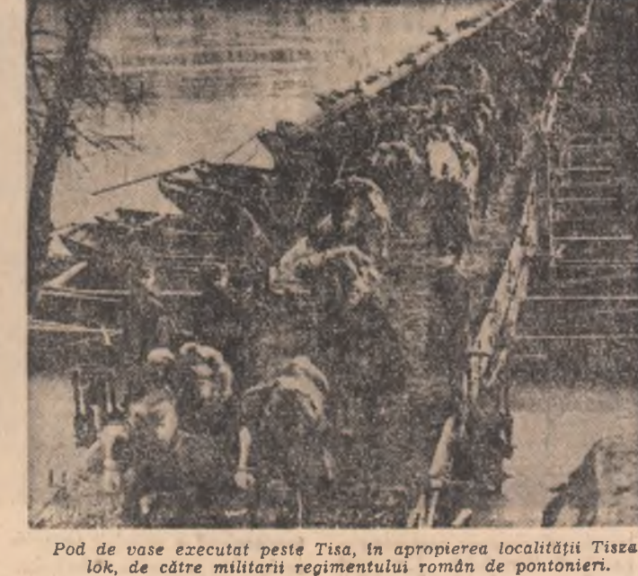
Pod de vase executat pe Tisa, în apropierea localității Tiszalok, de către militarii regimentului român de pontonieri.

masiv și au ajuns la frontiera cu Cehoslovacia. ● În luptele pentru eliberarea Ungariei efectivele române s-au ridicat la 17 divizii, un corp aerian, două brigăzi de artilerie antiaeriană, o brigadă de căi ferate și alte unități și formații specializate totalizînd circa 210 000 oameni. ● Trupele române, au cucerit 3 masive muntoase, au forțat 4 cursuri mari de apă, au eliberat 1 237 de localități din care 14 orașe, pierzînd 42 700 ostași — morți, răniți sau dispăruți.