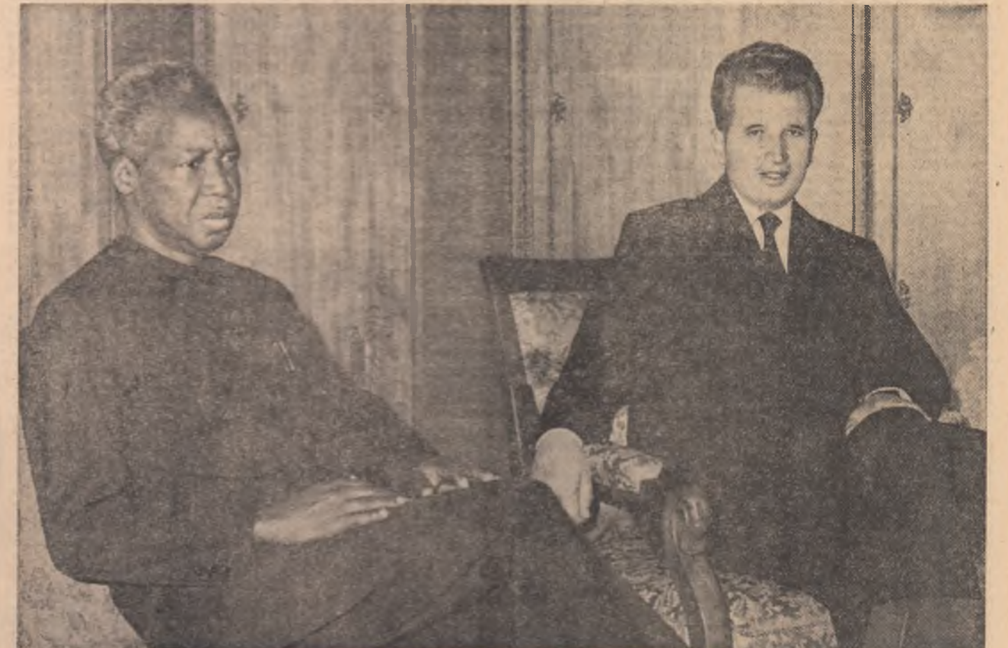
Luni după-amiază, Julius K. Nyerere, președintele Partidului Uniunii Naționale Africane din Tanzania, președintele Republicii Unite Tanzania, a făcut o vizită protocolară tovarășului Nicolae Ceaușescu, secretar general al Partidului Comunist Român, președinte Republicii Socialiste România. Desfășurată într-o atmosferă de căldură cordialitate, vizita protocolară a prilejuit un prim schimb de vederi în cadrul convorbirilor oficiale dintre cei doi șefi de state consacrate dezvoltării și adîncirii prieteniei și colaborării multilaterale româno-tanzaniene, în folosul celor două țări, partide și popoare, al cauzei păcii și înțelegerii în lume.

Noua întîlnire la nivel înalt româno-tanzaniană marchează un moment de seamă în evoluția relațiilor bilaterale, ea constituind încă o mărturie pregustată a dorinței și hotărîrii țării noastre!