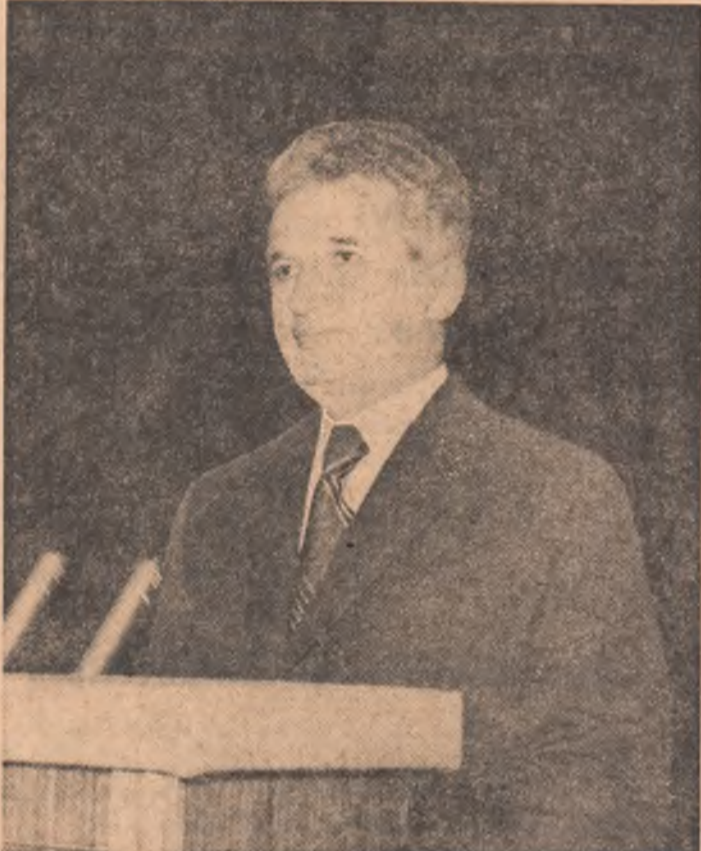
Simați tovarăși și prieteni,

Poporul român urmărește cu viu interes vastă operă creatoare desfășurată de oamenii muncii din Bulgaria vestice și prietenă, sub conducerea partidului lor comunist, rezultatele remarcabile obținute în înfăptuirea hotărârilor celui de-al X-lea Congres al Partidului Comunist Bulgar. Ne bucurăm în mod cel mai sincer de succesul poporului frate bulgar, căruia îi urăm din toată inima victorii tot mai mari pe drumul măreț al edificării societății socialiste, al bunăstării și fericirii. (Aplauze puternice, prelungite).