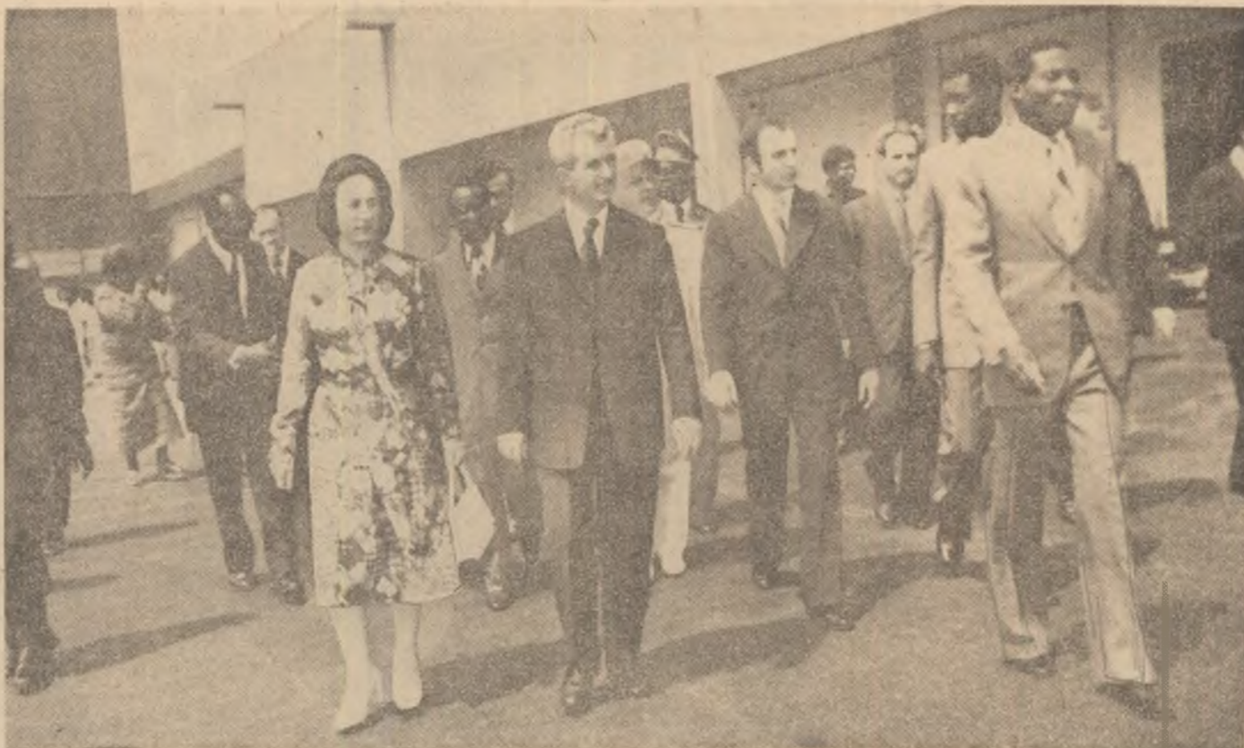
La întreprinderea de prelucrare a fructelor arborelui de cacao