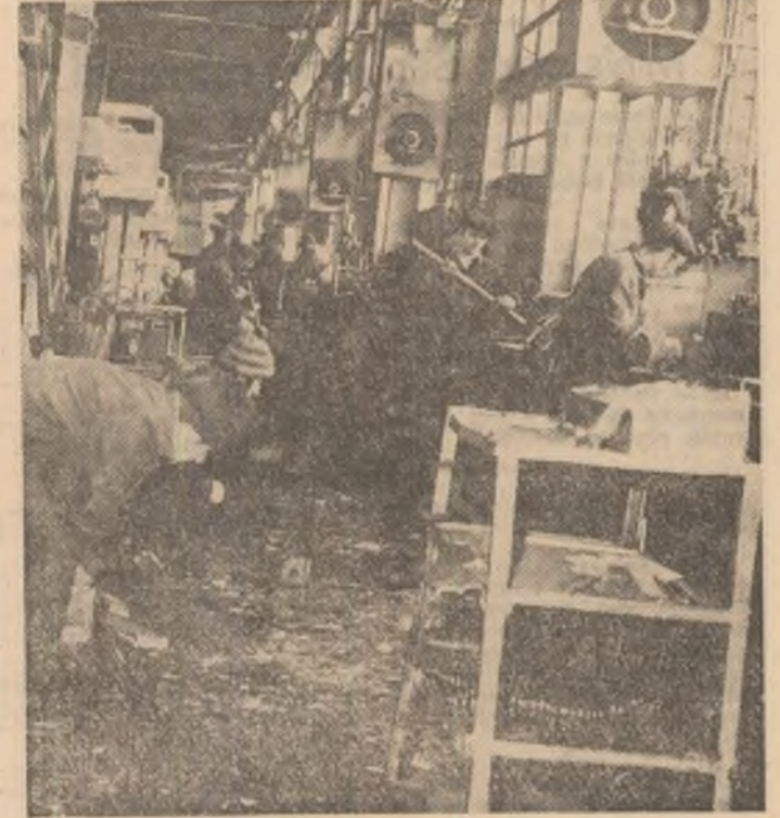
La „Semănătoarea” se acționează intens pentru reluarea lucrului din pînă a producției