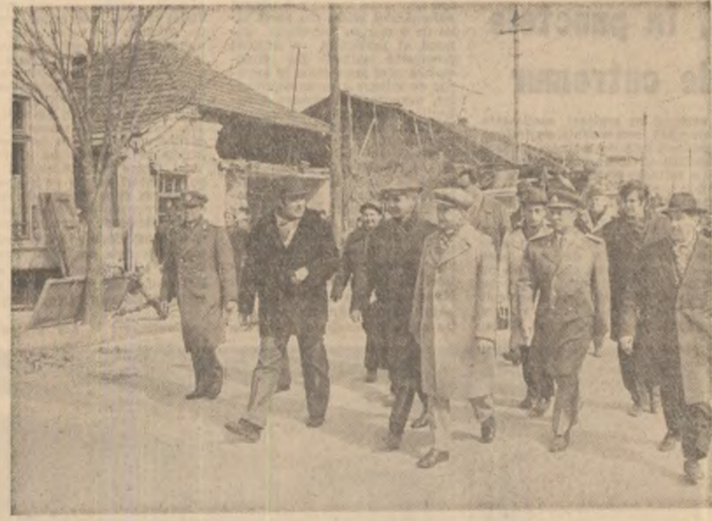
Pe străzile orașului Zimnicea