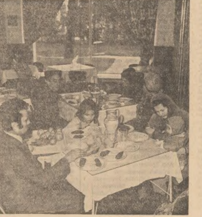
Sinistrați luînd masa la cantina studențească de pe Bd. Gh. Gheorghiu-Dej