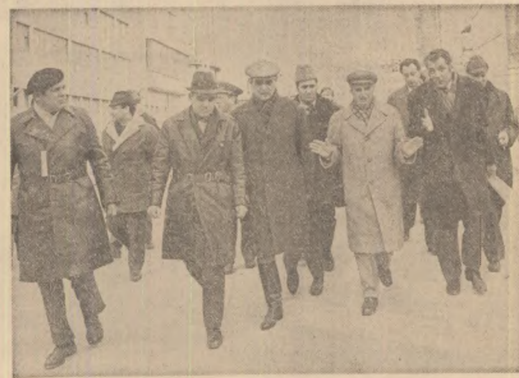
La Turnu Măgurele