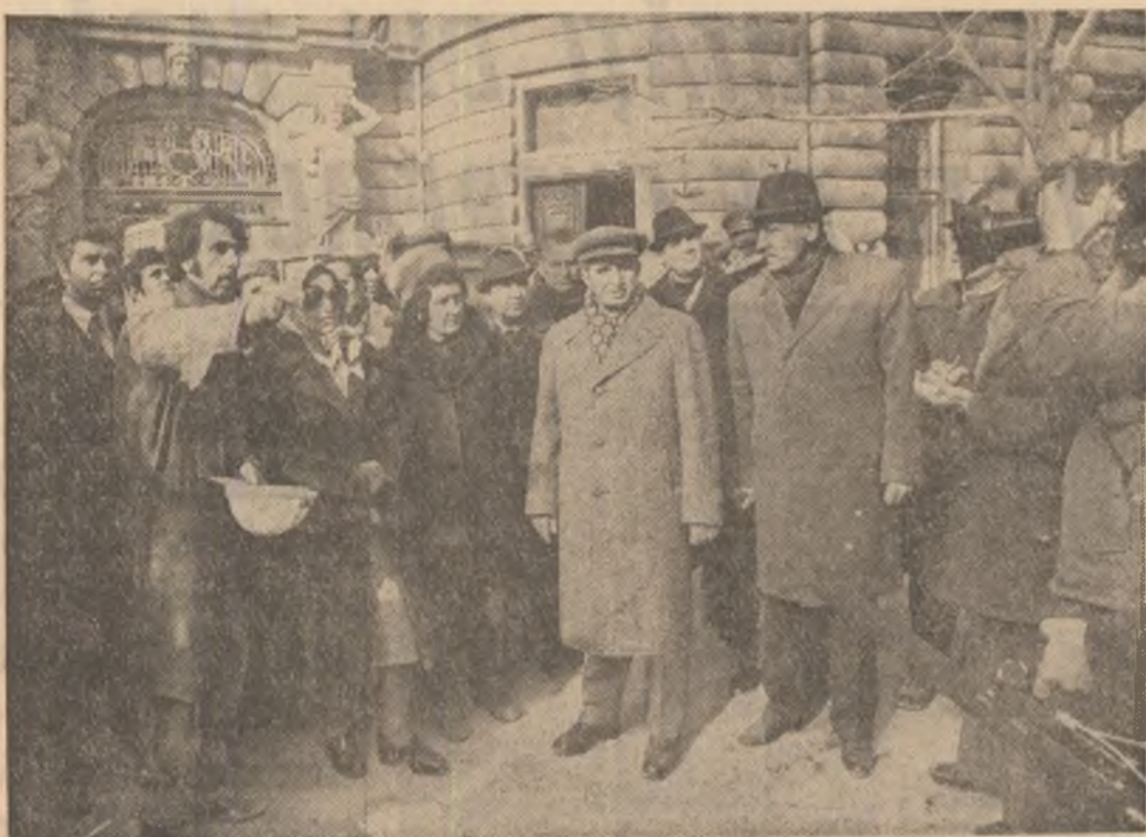
Lângă blocul „Continental”