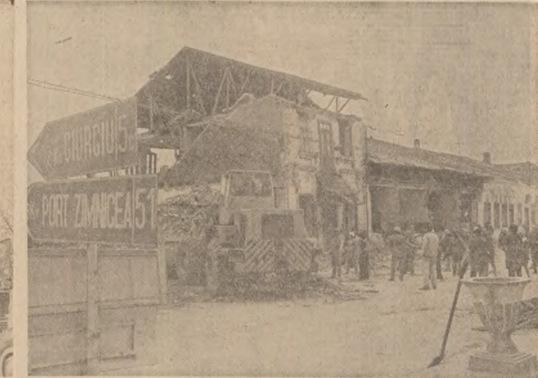
Astfel arată patru cinciimi din clădirile din Zimnicea