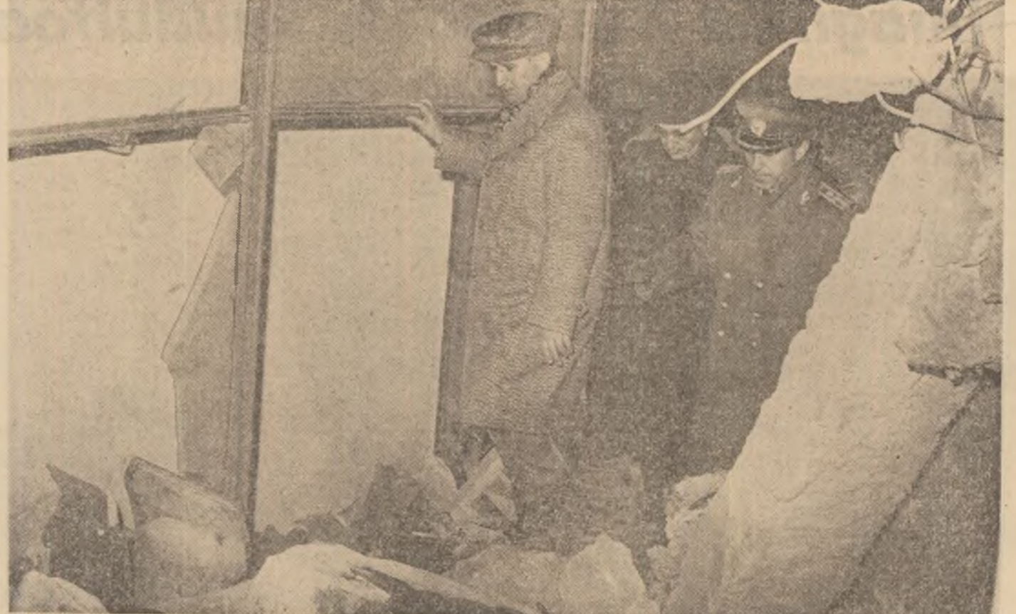
Acolo unde a fost un mare imobil de pe Calea Victoriei