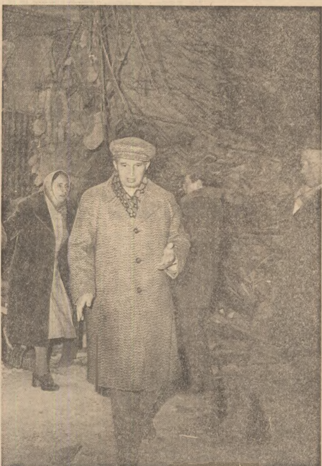
La blocul cofetăriei „Casata” în seara zilei de 6 martie

Prezent din zorii zilei și pînă noaptea tîrziu pe frontul salvării oamenilor și a bunurilor, al refacerii și reîntrînirii în activitatea normală a tuturor sectoarelor economico-sociale care au avut de suferit de pe urma cutremurului, tovarășul Nicolae Ceaușescu a mobilizat, peste tot unde s-a aflat, în cursul acestor zile, prin exemplul personal de înaltă dăruire comunistă și profund umanist, întru salvarea și înlăturarea cît mai grabnică a urmării seismului, de depășirea patriei noastre, prin care trece moartea.