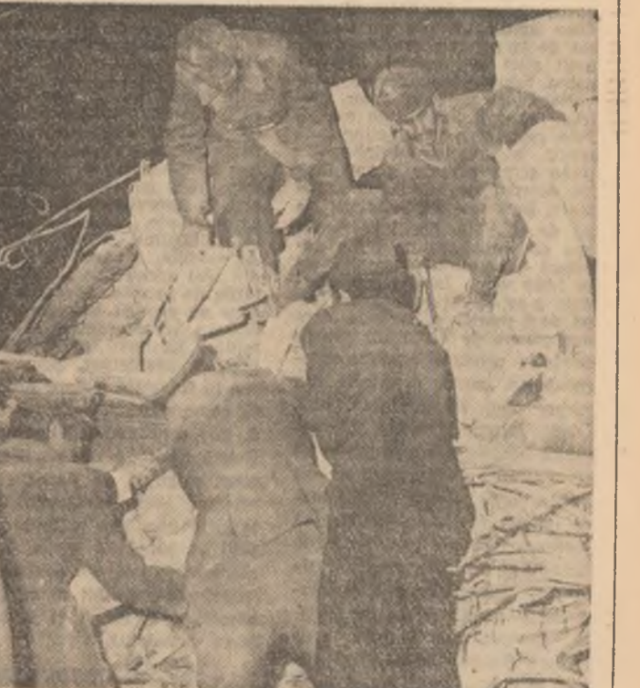
Scenă din strada Rosetti.