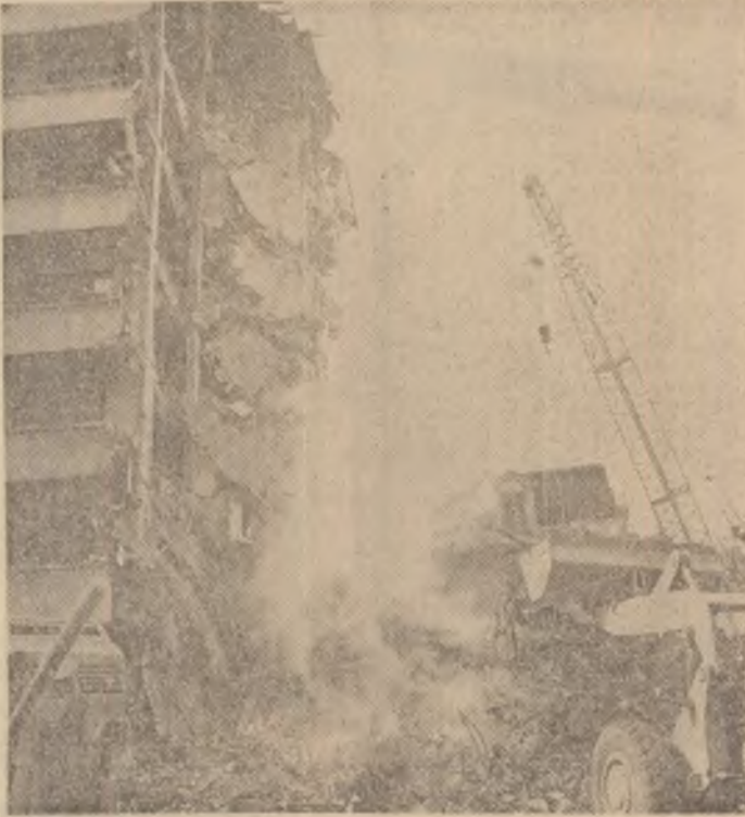
Acestea sint vestigiile unui bloc de pe b-dul Magheru