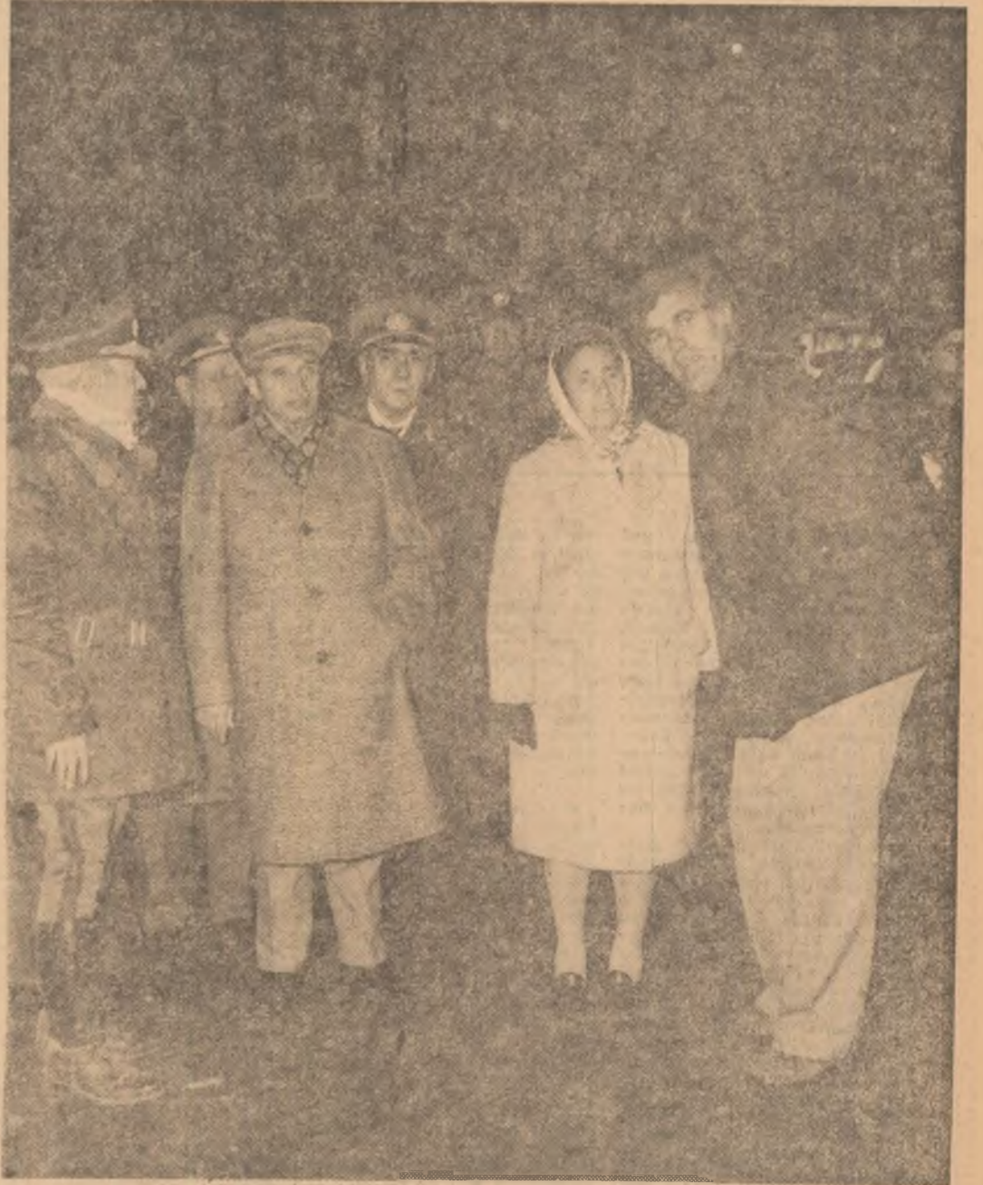
La orele serii, din nou in mijlocul cetătenilor Capitalei