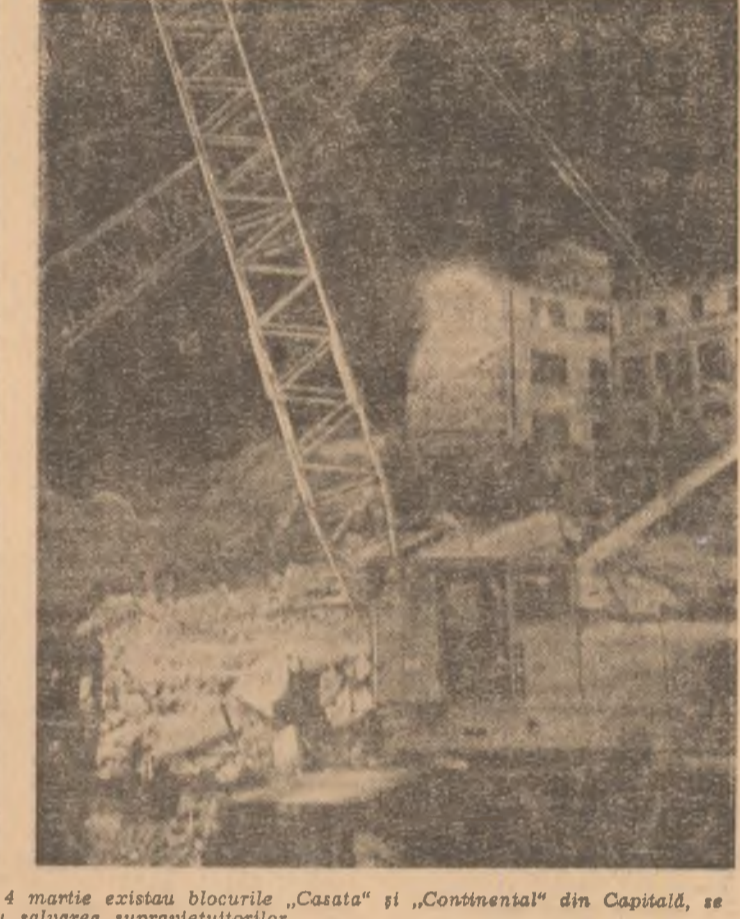
La lumina zilei și a reflectoarelor, noaptea, acolo unde pînă în 4 martie existau blocurile „Casata” și „Continental” din Capitală, se lucrează cu grijă pentru salvarea supraviețuitorilor

Datorită măsurilor operative întreprinse, aprovizionarea cu bunuri de consum a populației din Capitală și din celelalte localități afectate de cutremur decurge normal. Numai în cursul nopții și primei părți a zilei de 7 martie, din diverse județe ale țării au fost livrate Capitalăi 283 tone pîne, 755 tone carne, 634.000 litri de lapte, 64 tone preparate din carne, 159 tone tensiune un număr mare de grupuri și stații de transformare, 2,1 milioane litri de apă minerală și altele produse. De asemenea, se asigură livrarea de produse alimentare pentru județele care au avut de suferit de pe urma seismului. Hotărârile luate de Comitetul Politic Executiv, indicațiile date la fața locului de către secretarul general al partidului în zonele cel mai grav afectate din Capitală și din unele județe, pentru accelerarea lucrărilor de salvare a vieților omenești, de rezolvare operativă a problemelor populației, precum și pentru repunerea de urgență în făgașul normal al activității productive a tuturor întreprinderilor și unităților care au suferit avarii, reclamă din partea tuturor organelor de partid și de stat din Capitală și județe măsurii hotărâri și antrenarea tuturor forțelor, a maselor de oameni ai muncii, organizarea exemplară, într-un spirit de înaltă ordine și disciplină, a întregii activități.