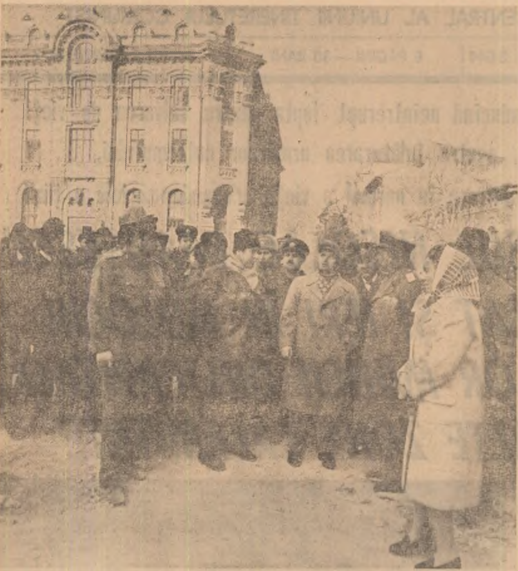
În Capitală, la primele ore ale dimineții