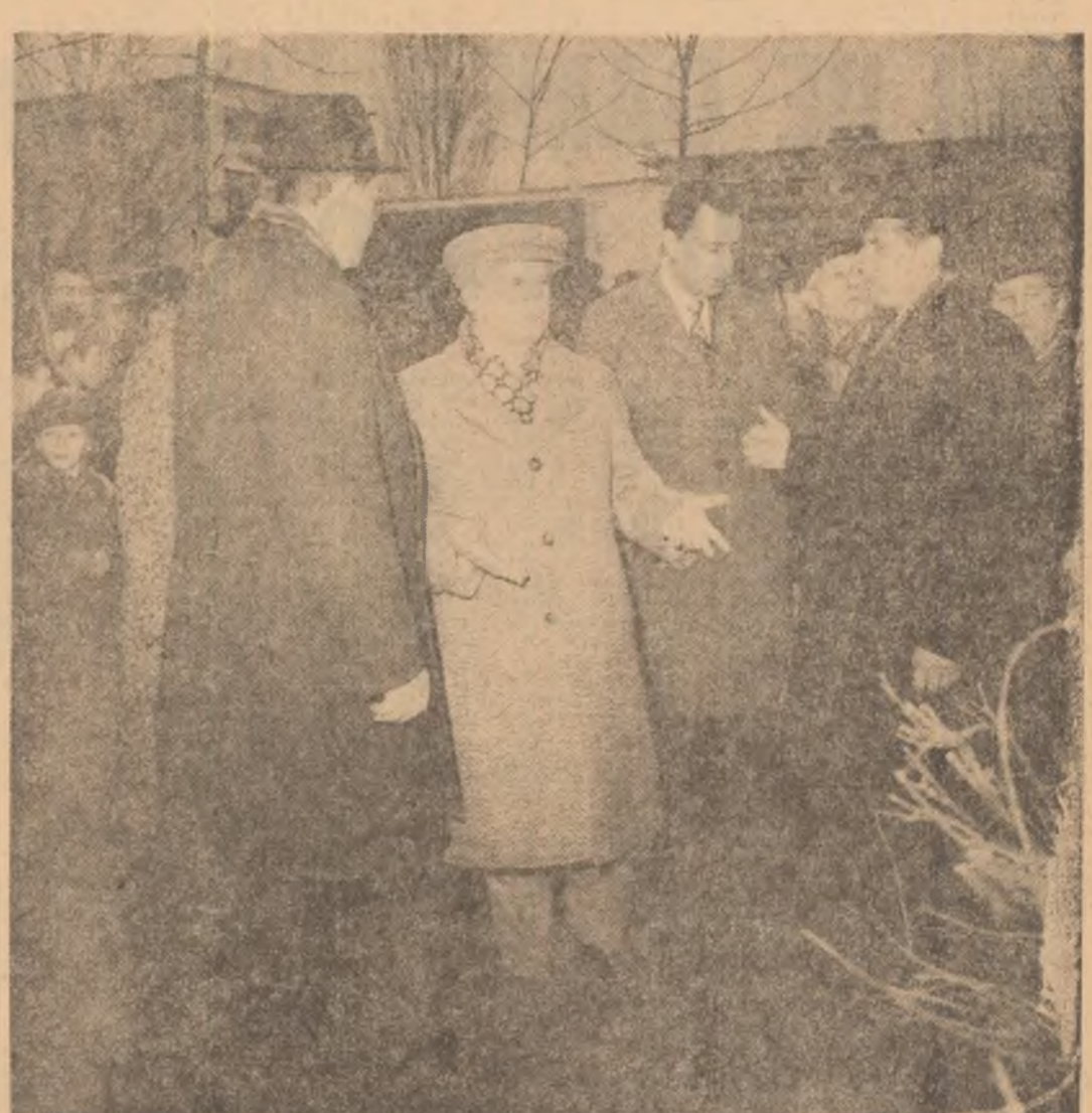
In municipiul Ploiești

Cu vizita din Capitală se încheie cea de-a treia zi de cînd tovarășul Nicolae Ceaușescu se află prezent, cea de cea, în locurile greu lovite de forța distrugătoare a seismului, urmărind, neîntrerupt, evoluția situației atât în Capitală cit și în județele țării și stabilind măsurile ce se impun pentru depășirea momentelor grele, pentru înlăturarea consecințelor dezastrului provocat de cutremur, mobilizînd forțele națiunii în vederea normalizării cit mai rapide a activității în zonele calamitate, pentru asigurarea progresului neîntrerupt al vieții economice și sociale, al edificării socialismului în România.