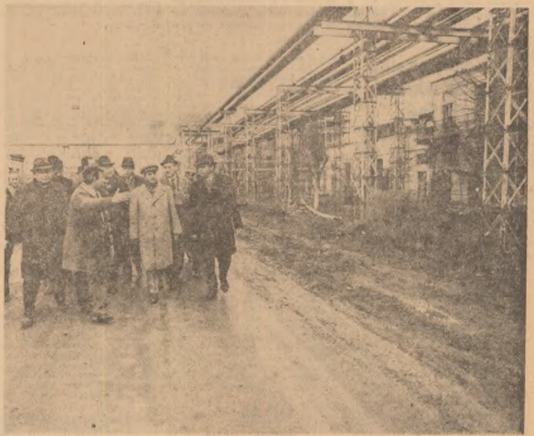
La Combinatul petrochimic din Teleajen