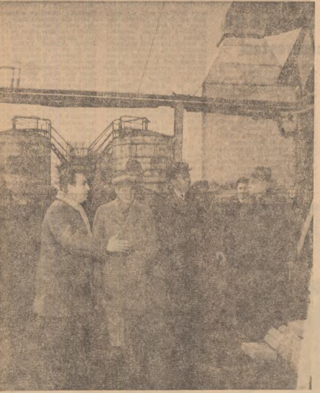
La Combinatul de îngrășăminte chimice Valea Călugărească