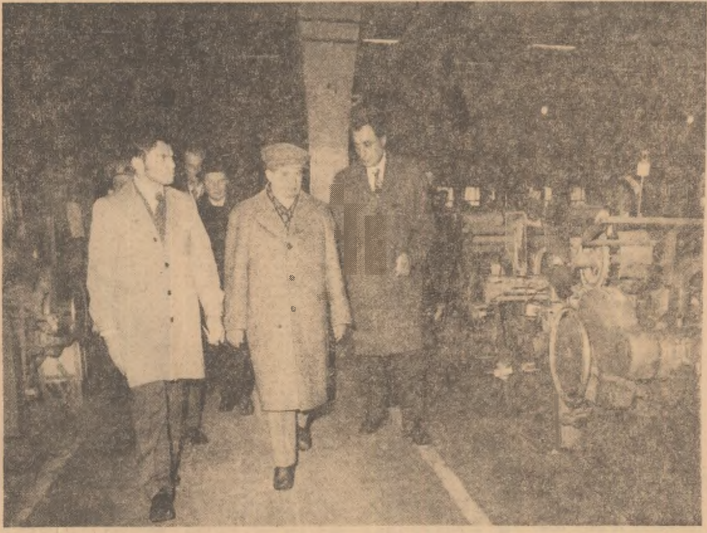
La întreprinderea „Textila” - Buzău

vite de cutremur ale Bucureștiului. Cu acest prilej, secretarul general al partidului a constatat că eforturile neîntrerupte, de zile și nopți în sir, ale echipeilor de intervenție alcătuite din