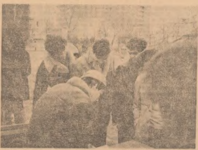
La Institutul de medicină și farmacie din București, deși se lucrează intens la degajarea clădirii grav avariate iar mulți studenți se află la datorie, în spitale, s-a făcut orarul pentru reînnoșarea cursurilor. Au fost analizate cu grijă condițiile în care poate reîncepe activitatea didactică și au fost redistribuite pe facultăți și aici spațiile neafectate de cutremur. Studenții, aflați la institut, au fost înștiințați cum își vor desfășura activitatea pentru că, așa se reintre în normal, în cea mai mare ordine. Fotografia surprinde o discuție colegială între studenți care se informează asupra desfășurării cursurilor.