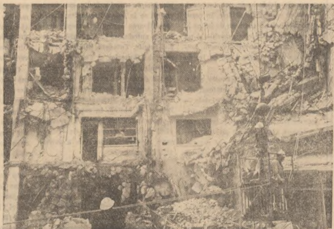
Așa arată blocul la parterul căruia se afla restaurantul „Dunrea”