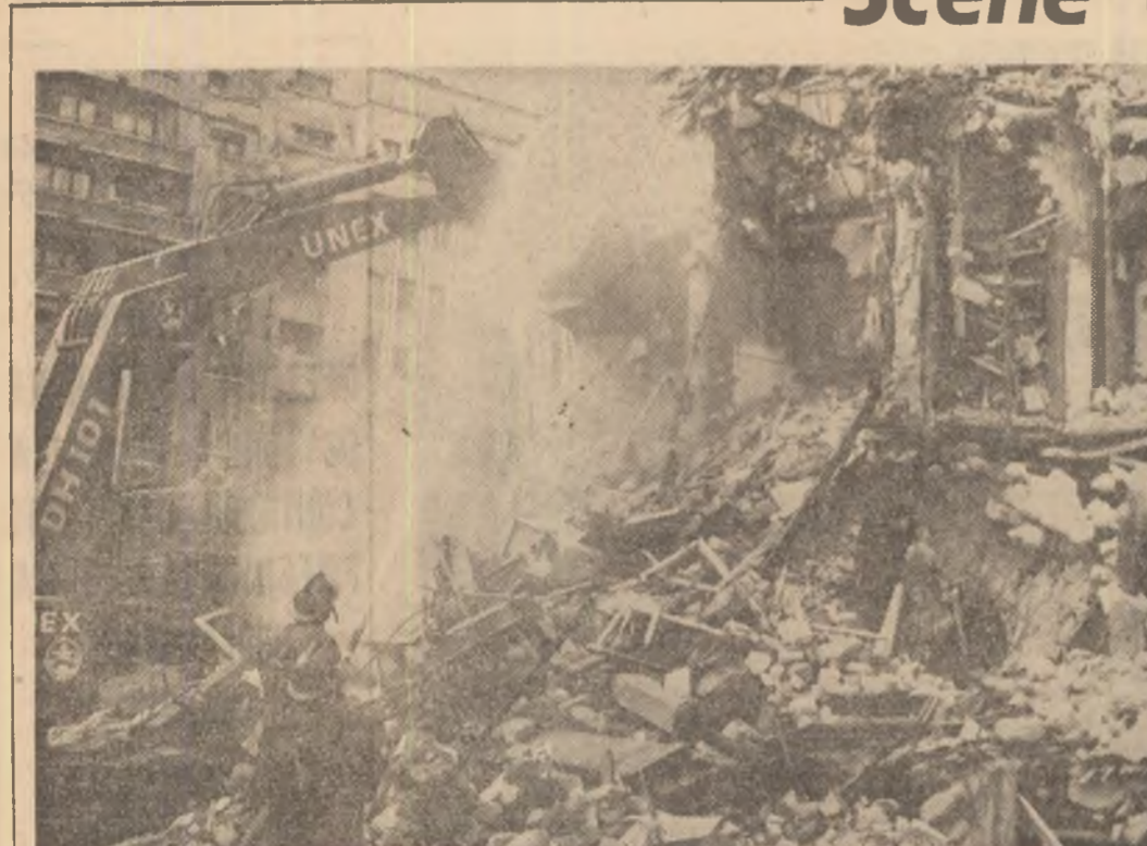
Ruinele sfărâmate ale fostului bloc „Casata”