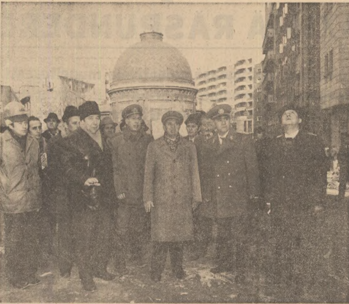
(Urmare din pag. a II-a)

din stilul de susținere a suferit o avarie similară. Secretarul general al partidului, constatând că nu se lucrează cu suficientă forță pentru restabilirea grabnică a situației, a cerut ministrului Ioan Avram, directorul unității să ia de îndată toate măsurile ce se impun pentru reluarea activității productive, deocamdată chiar în condiții improvizate. Întrucât avaria nu pun în pericol clădirile celor două hale, ele putând fi reparate fără mari dificultăți. Sunt întru-totul aici toate condițiile pentru ca acest obiectiv să poată fi realizat imediat. Mașinile și utilajele au fost verificate din punctul de vedere al stării lor tehnice, remedierile necesare