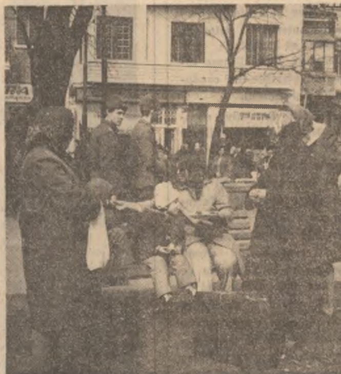
Una din familiile bucureștene sfîșirate