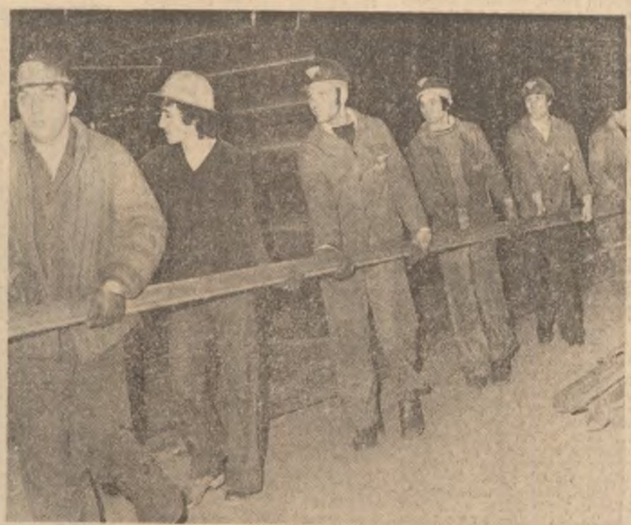
Umăr la umăr, cu eforturi unite pentru înlăturarea efectelor cutremurului.