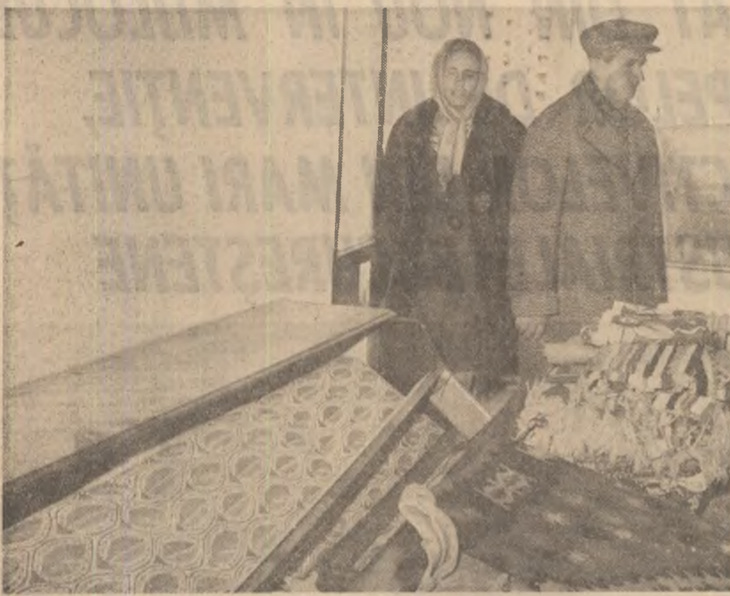
(Urmare din pagina 1)

În care se evacuează ruine sfărâmate, evitate care n-au mai fost descoperite decât trupuri neînsuflete. Cu toate acestea, respectând întotdeauna dispozițiile tovarășului Nicolae Ceaușescu, echipele de intervenție acționează rapid, dar în același timp cu cea mai mare precauție, evitând orice acțiune tehnică ce ar putea pune în pericol pe posibii supraviețuitori.