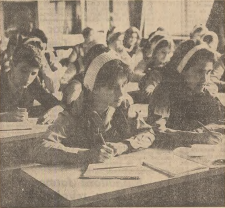
In sălile de clasă sau în atelierele școlii, activitatea a început cu toată seriozitatea