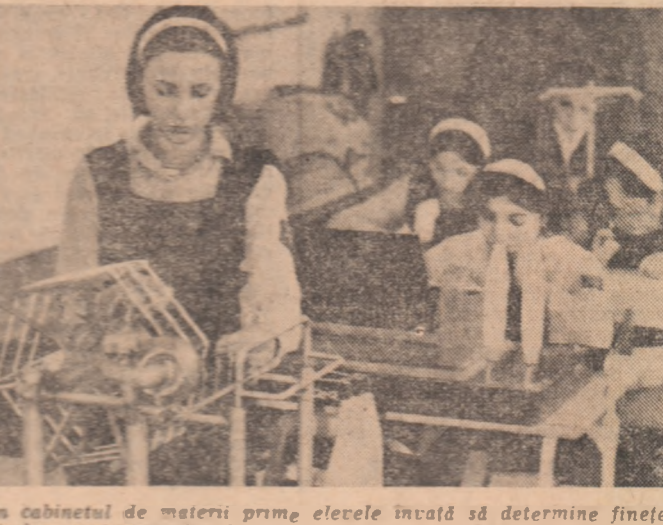
În cabinetul de matri primă, elevele învață să determine finețea firelor, rezistența lor la tragere, rupere, torsione. Aici s-au întreprins și primele cercetări care au condus la proiectarea „Tercetului Valter”, primul material realizat de Grupul școlar M.T.U. de pe lângă întreprinderea „Dunăreana” din Giurgiu

De asemenea, în ale cărei „culcușuri” este desfășoară pe tot atîtia planuri corespunzătoare principalelor probleme pe care le ridică producția. De pildă, absolutele vor lucra, din prima zi, pe utilaje complexe, avînd o zonă largă de deservire. Tesăturile frunțate de la „Dunăreana” deservește simultan