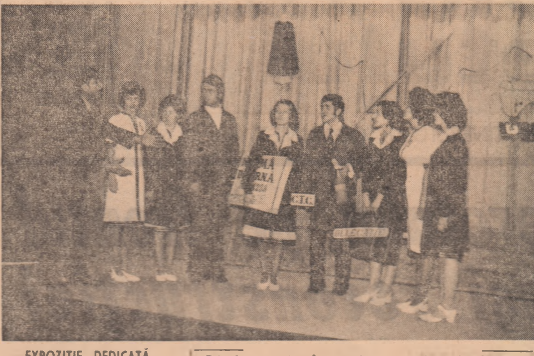
EXPOZITIE DEDICĂTĂ EVENIMENTELOR DE LA 1877 ȘI 1907

În ambianta desfășurării fazei județene a Festivalului Național „Cîntarea României”, la sediile de artă din Galați s-a deschis simbul vernisajului „Salonul de primăvară”, care reunește lucrări de pictură, sculptură și grafică, consacrate de artiștii plastici aiături evenimentelor de importanță istorică de la 1877 și 1907. Data fiind organizarea tematică, în expoziție domină portrele și compozițiile istorice. Trăirea patriotică intensă a fost metamorfozată în creația de mijloc artistică roșie de idei la Saloana sau la Buzău. Sînt toate întreprinderi noi, care ne aşteaptă ca pe adevărate muncitoare. De aceea, organizația noastră și-a propus ca prim obiectiv o acțiune complexă care, rezumată în cîteva cuvinte, se poate numi „Integrarea în producție fără nici o zi de acomodare”. Acțiunea, în ale cărei „culcușuri” este desfășoară pe tot atîtia planuri corespunzătoare principalelor probleme pe care le ridică producția. De pildă, absolutele vor lucra, din prima zi, pe utilaje complexe, avînd o zonă largă de deservire. Tesăturile frunțate de la „Dunăreana” deservește simultan