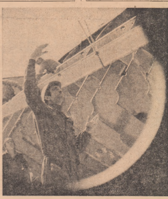
Șantierul naval Constanța. Secvență obișnuită de muncă la construcția vaselor de mare tonaj.

● DEPĂȘIREA cu 1.619 lei a nivelului producției muncii pe fiecare lucrător a permis muncitorilor, inginerilor și tehnicienilor din întreprinderile industriale ale județului Bacău să obțină, peste prevederile primului trimestru al anului, o producție în valoare de 166,5 milioane lei.