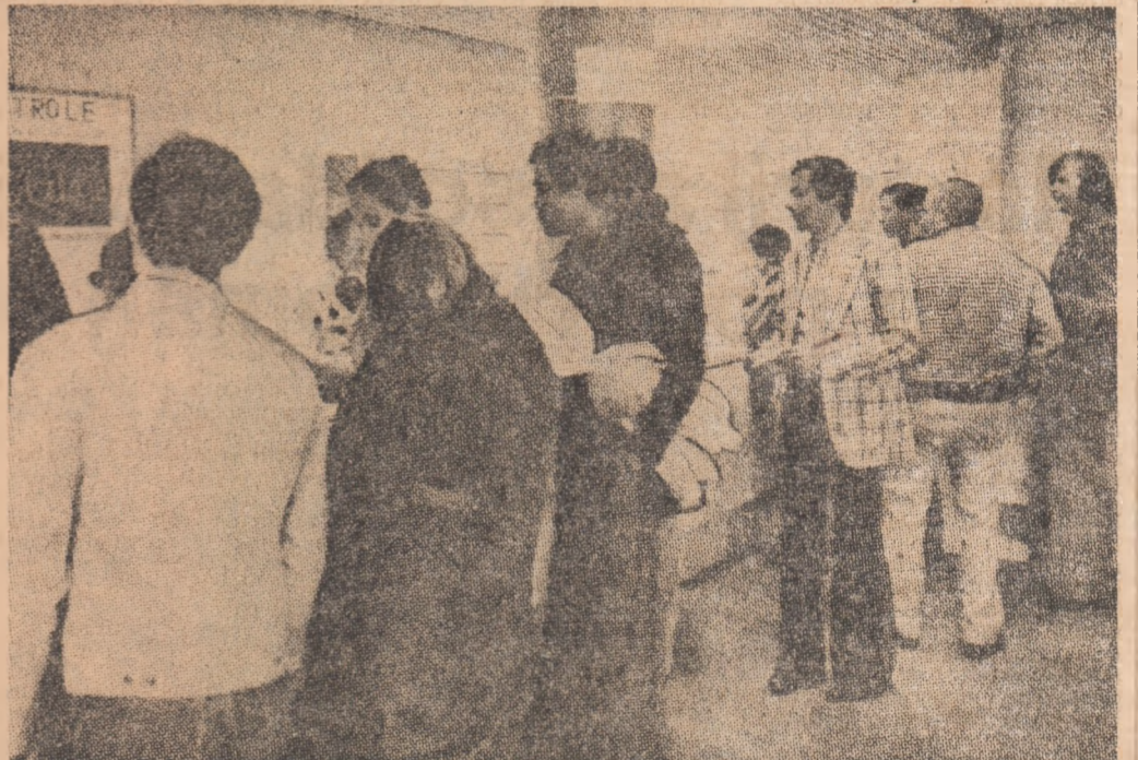
La 18 ani în căutarea primului loc de muncă într-o lume a tuturor „posibilităților”, o speranță ce se dovedește, de multe ori, iluzorie.

În S.U.A. Comisia economică a Congresului american a publicat un raport asupra influenței șomajului asupra moralității și criminalității. Documentul reamintește concluziile profesorului Harvey Brennan de la Universitatea John Hopkins, care de 15 ani se ocupă de această problemă. Datele subliniate de el se referă la perioada 1970—1975, cînd șomajul a crescut în S.U.A. de la 3,5 la sută la 4,9 la sută. Raportul evidențiază consecințele directe ale creșterii șomajului: moartea a 28.440 oameni ca urmare a stresului, sporirea