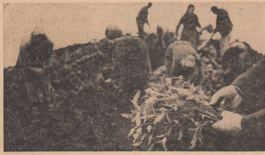
In ferma legumicolă a cooperativei agricole din Glodeanu Sărat, județul Buzău, se desfășoară intens plantatul tomatelor pentru producția de primăvară.

Începem cu acest număr un nou serial dedicat răscoalelor de la 1907 — o cronică a dezbaterilor parlamentare din primăvara fierbinte a aceluia an. Alături de demagogia partidelor politice ale vremii, de ridicole discuții despre chestiunea țărănească, se desfășoară însă adevărată istorie, cea pe care țărănimia o înțelegea și o scrie cu singele său. Ciclul de reportaje își propune să pună față în față meschinia dispută de interese între politicienii vremii, cu luța țărănimii pentru adevăr și dreptate, pentru un destin omenesc. Adunarea deputaților — adunare de fapt a marilor proprietari și potențați — a refuzat atunci, sub presiunea răscoalei, să ia vreo hotărîre pentru îmbunătățirea soartei țărănilor. Cuvîntul de ordine al Parlamentului a fost: Represiune. Represiune cu orice preț, cu orice sacrificii... Ca și altădată, la 1907 istoria a fost făcută nu de tagma jefuitorilor, ci de popor, singurul care presimțea, peste timp, revoluția care avea să vină. IN PAG. A 2-A