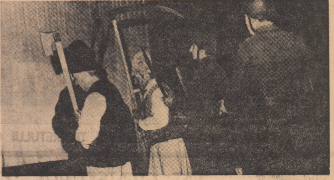
Scenă din piesa „1907” în interpretarea artiștilor amatori de la Întreprinderea metalurgică Bacău, spectacol cu care aceștia au promovat într-o fază superioară a Festivalului „Cîntarea României”

alți timp cit aie și vorba, replică după replică, scenă după scenă. „Amorul patriei și-al steagului” — cum zice un personaj.