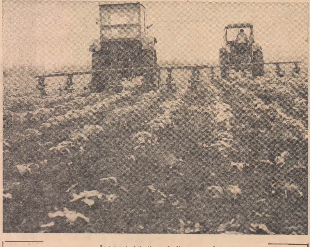
Lucrări de întreținere la floarea-soarelui

analiză, iar mecanizatorul nu a dispus de ordin de lucru. Acum cultura este firav răsarită, fără o densitate optimă. Volumul de muncă în agricultură este acum deosebit de mare. De aceea organizarea riguroasă a muncii pentru realizarea ritmică și de calitate a lu-