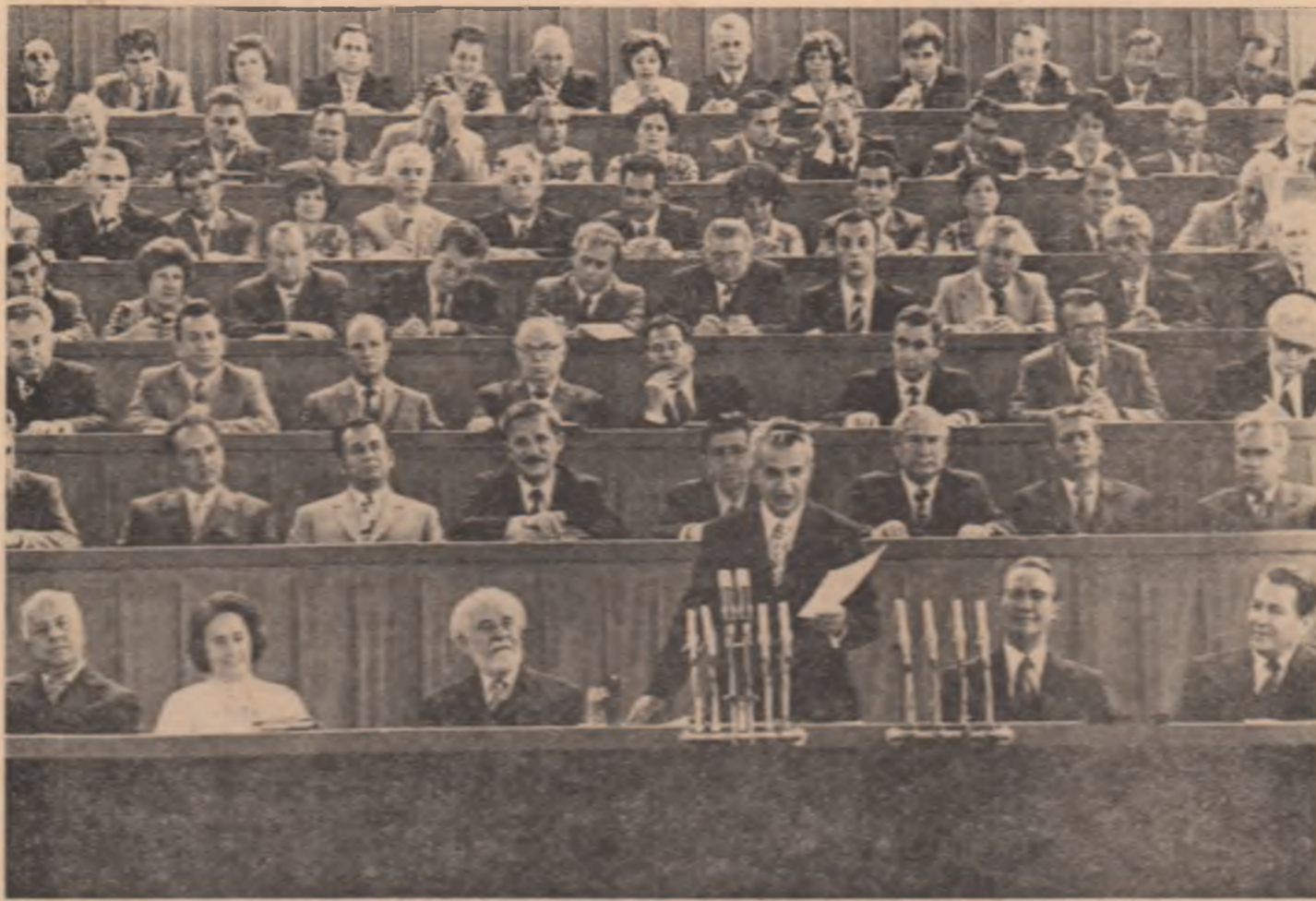
Și trebuie ca, acolo unde înțelegim astfel de probleme, să le înțelegem cu desăvîșire. (Aplauze puternice).

Este necesar să se înțeleagă bine că fiecare director, fiecare consiliu de conducere răspunde, în fața clasei muncitoare, a poporului, de buna gospodărie a bunurilor încredințate — pe care trebuie să le gospodărească mai bine decât gospodărește propriile sale mijloace. Aceasta este cerința esențială față de un conducător de unitate economică — și trebuie să întindem și să întărim controlul financiar, disciplina și ordinea în toate domeniile de activitate. (Aplauze puternice).