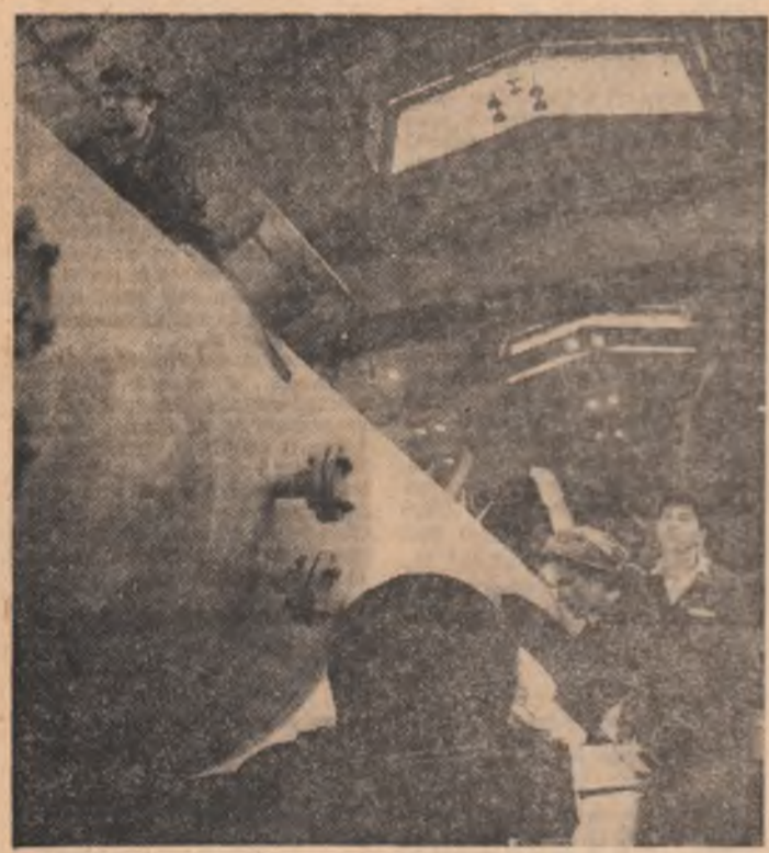
Întreprinderea de utilaj chimic „Grivița Roșie” din Capitală. Un nou lot de colone pentru instalații chimice, destinat exportului, va fi în curînd gata pentru a fi expediat beneficiarilor.