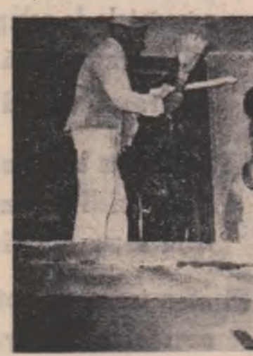
Finișajele sînt aproape gata la imobilul din Calea Victoriei nr. 105, 111-114 și 124.