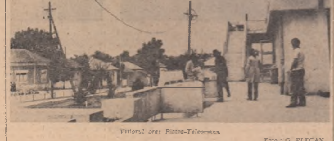
Viitorul oras Pitesti-Teleorman.