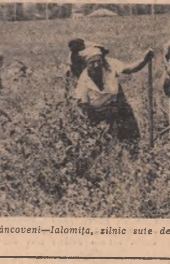
La Cooperativa agricolă din Brâncoveni—Ialomița, zilnic sute de brațe trimit legume proaspete pietelor de desfacere.

• PENTRU ALIMENTAREA CORESPUNZĂTOARE A BAZINELOR DE ABSORBȚIE — DEVIERI ÎN ALBIA RIURILOR • PE CANALELE DE EVA-CUARE A TORENTILOR, APA ESTE RIDICATĂ CU POMPELE LA NIVELUL CULTURILOR • ACOLO UNDE TERENURILE NU SÎNT AMENAJATE, COOPERATORII FOLOSESC BUTOAIILE, CISTERNELE ȘI CHIAR GĂLEȚILE