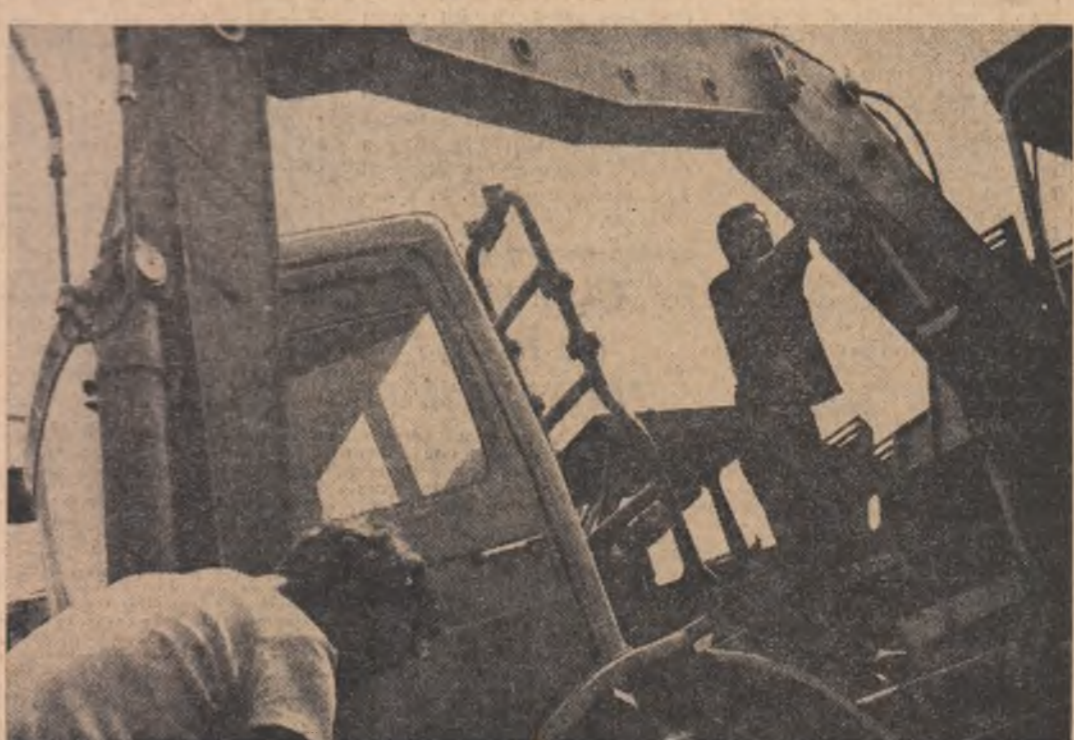
Cînd asamblează utilaje complicate, dar perfecte, tinerii muncitori de la Intreprinderea „Progresul” Brăila se gîndesc la versurile argeșiene: „O viață nouă, un om de fier: mașina”.

Cu prilejul vizitei de lucru în județul Gorj a tovarășului Nicolae Ceaușescu, secretar general al Partidului Comunist Român, președintele Republicii Socialiste România, posturile noastre de Radio și Televiziune vor transmite direct, astăzi în jurul orei 11.30, adunarea populară din municipiul Tg. Jiu, iar în jurul orei 16.30 adunarea populară din orașul Motru.