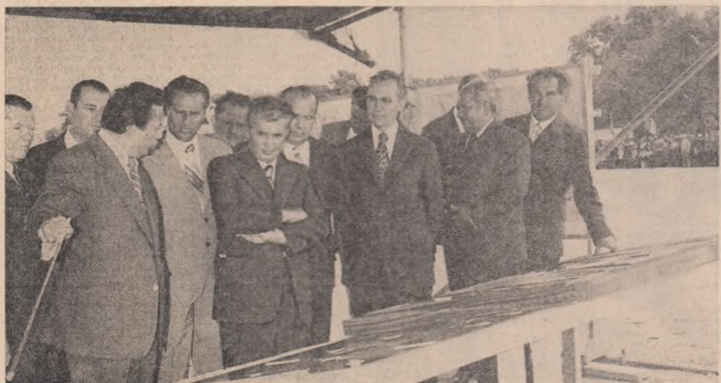
Împreună cu proiectanții și constructorii, pe locul viitorului șantier al sistemului hidroenergetic și de navigație Porțile de Fier II.

● Emoționanta manifestare de entuziasm a miilor de locuitori ai județului, dovada sinceră a sentimentelor de adîncă prețuire și bucurie prilejuite de noua întîlnire cu secretarul general al partidului ● Dezbatere rodnică cu muncitorii și specialiștii din unități economice, cu lucrătorii din agricultură, privind problemele concrete ale edificării economiei socialiste, ale ridicării necontenite a nivelului de viață și spiritual al întregului popor ● Recomandările, indicațiile și soluțiile date la fața locului de secretarul general al partidului, primite cu viu interes, cu deplină angajare muncitorească.