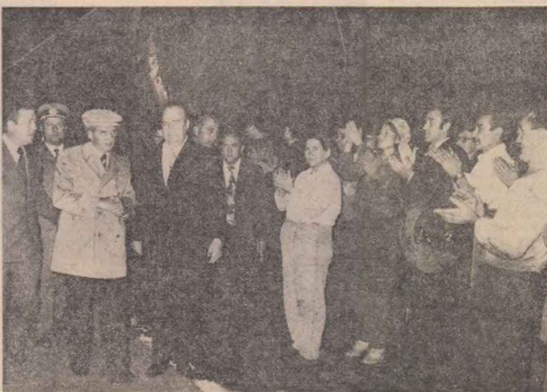
În dialog cu specialiștii și muncitorii de la Întreprinderea de vagoane.

Pe baza rezultatelor obținute în prima parte a cîincinalului, a resurselor realizate ca urmare a măsurilor de reducere mai accentuată a cheltuielilor materiale, a apărut posibilitatea alocării unor fonduri mai mari pentru progresul diferitelor sectoare ale economiei și, totodată, afectării a peste 35 miliarde lei în vederea creșterii într-un ritm mai înalt a nivelului de trai al poporului. După cum se știe, în conformitate cu hotărîrile Plenarei Comitetului Central, retribuiția reală va crește în acest cîincinal cu circa 30 la sută, față de 18—20 la sută cît se prevăzuse inițial. Începînd de la 1 iulie, o serie de ramuri au primit prima parte a majorării, apoi de la 1 august constructorii de mașini și alte categorii. Pînă la sfîrșitul anului, peste 3 milioane și jumătate de oameni ai muncii vor primi prima rată a majorării, iar în anul viitor toți oamenii muncii. În