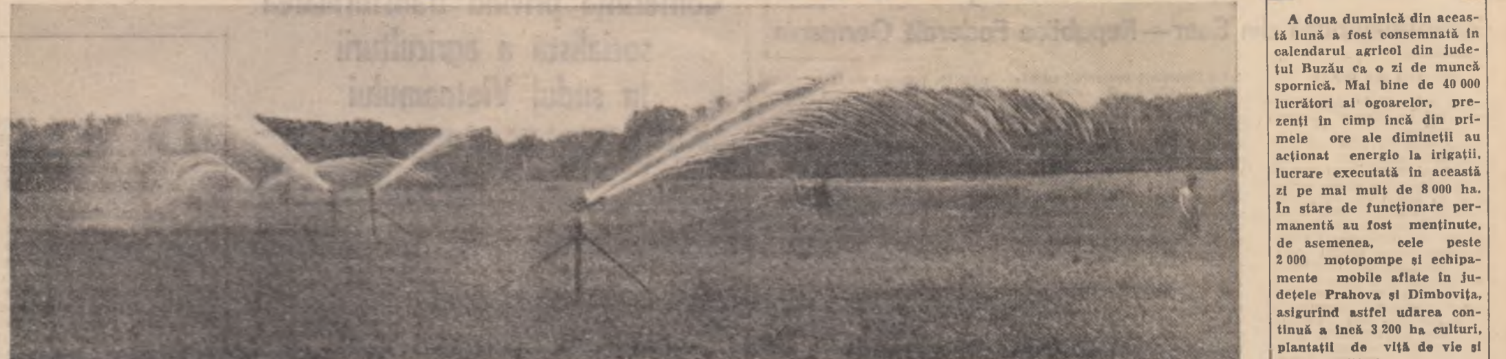
La C.A.P. Măisaru, județul Dimbovia, tragiștii stini operează în irigații prioritare