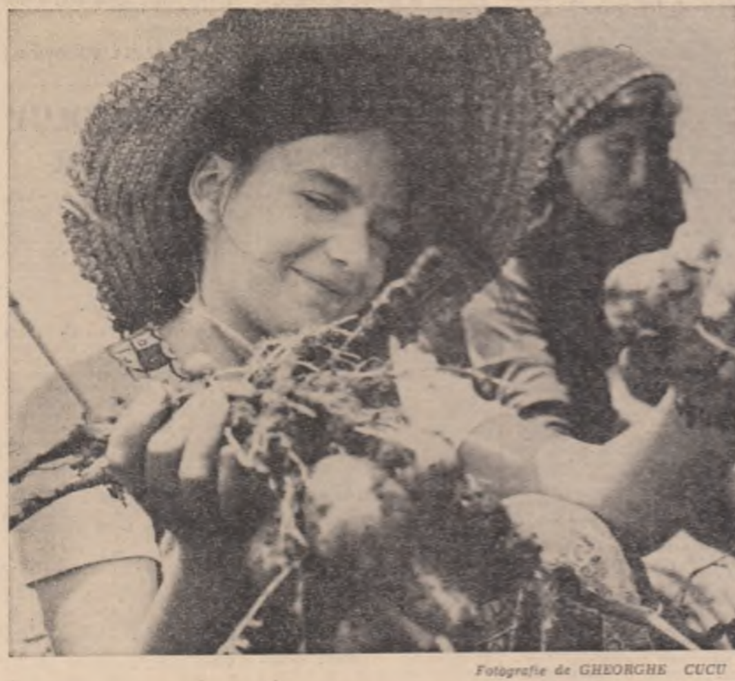
Fotografie de GHEORGHE CUCU