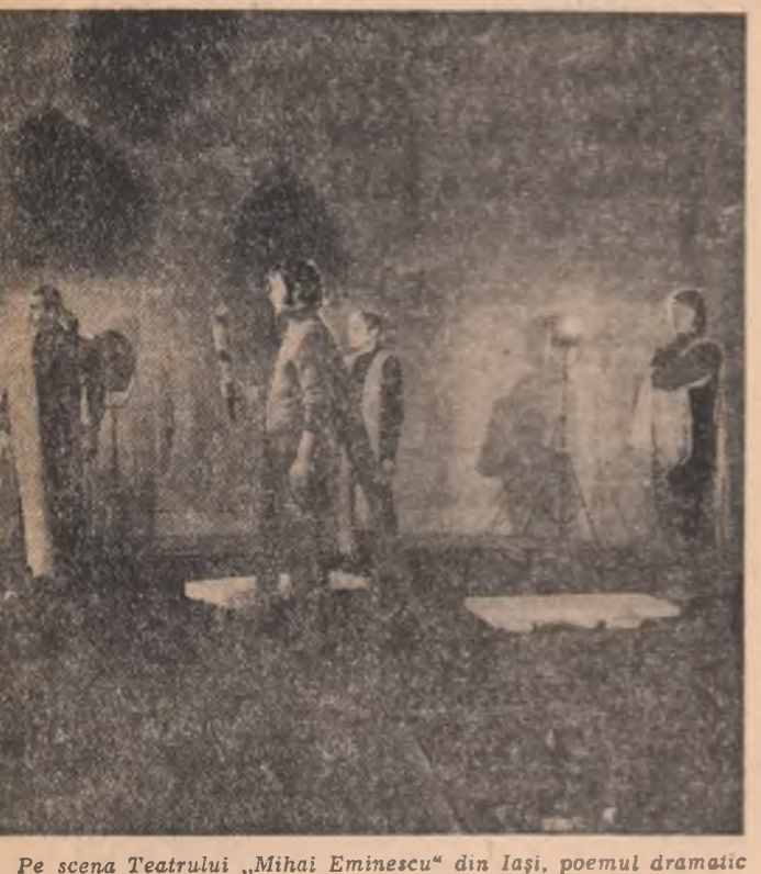
Pe scena Teatrului „Mihai Eminescu” din Iași, poemul dramatic „MUREȘANU” de Mihai Eminescu