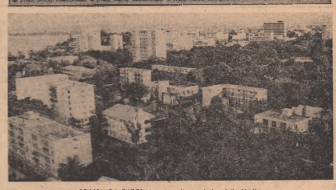
COASTA DE FIDES. Imagine din capitala țării, Abidjan