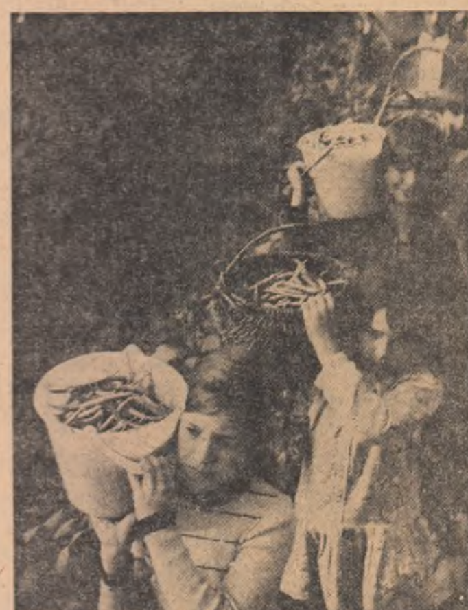
Elevii în sprîjinul lucrătorilor de pe ogoare