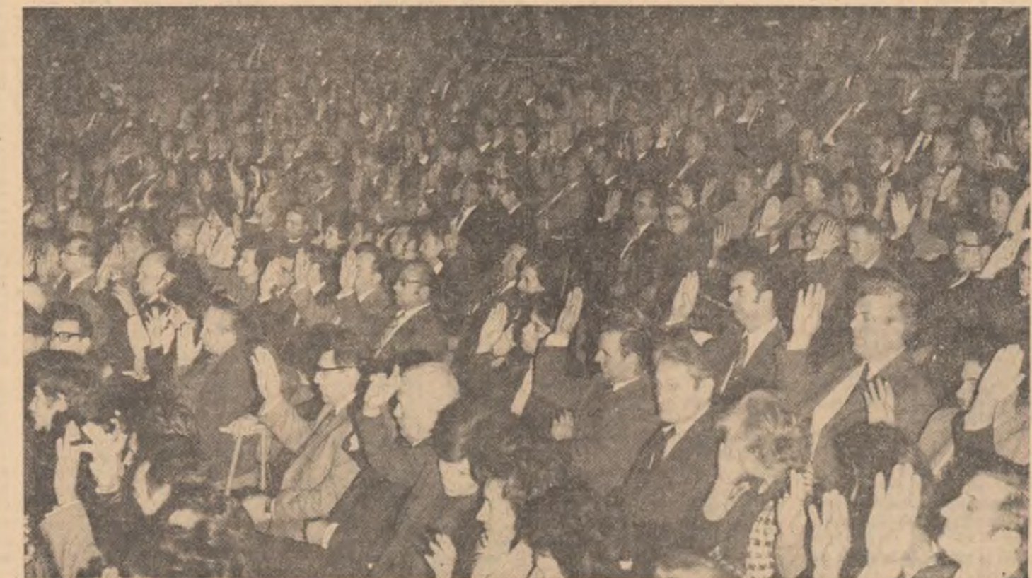
In continuare, s-a trecut la constituirea organelor Consiliului național al muncii. (Continuare în pag. a 11-a)