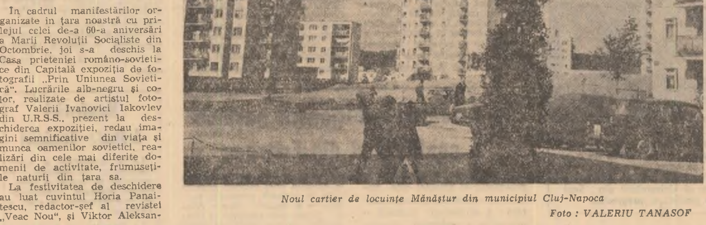
Noul cartier de locuințe Mândăștur din municipiul Cluj-Napoca.