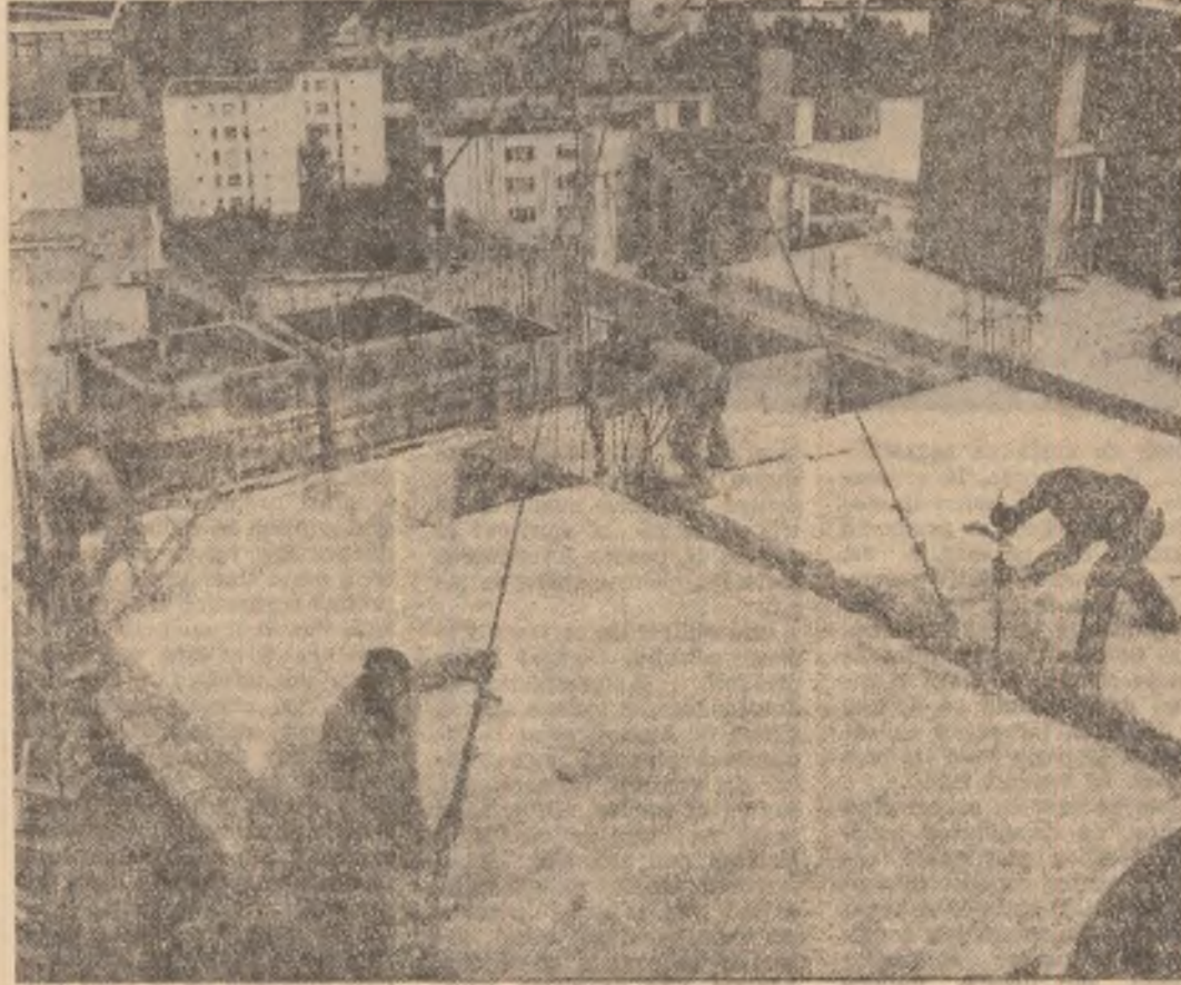
Zile de plin efort pentru constructorii de locuințe din Capitală care pregătesc un larg front de lucru pentru anotimpul rece