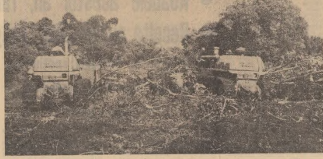
REPUBLICA SOCIALISTA VIETNAM: Acțiune de defrișare a unor terenuri din raza fermei Phuoc An, provincia Dac Lac, ce vor intra în circuitul agricol

Vorster et Co nu prididese în a căuta și găsi tot felul de chichite în voluminoasa legislație sud-africană. Scopul unor asemenea căutări este evident: încercarea de a întindea sau răpune pe toți oponentii unui regim care a ridicat la rangul de politică de stat discriminarea rasială.