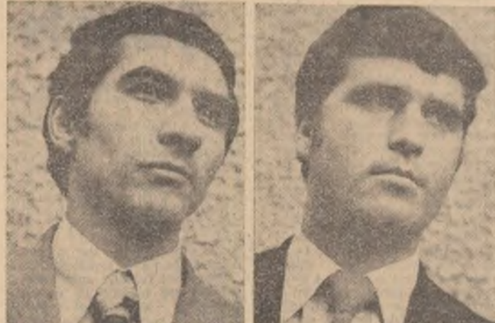
În spiritul democrației noastre socialiste, pentru circumscripția electorală nr. 37 au fost propuși să candideze pentru același loc Ion Firănescu și Ion Sianu