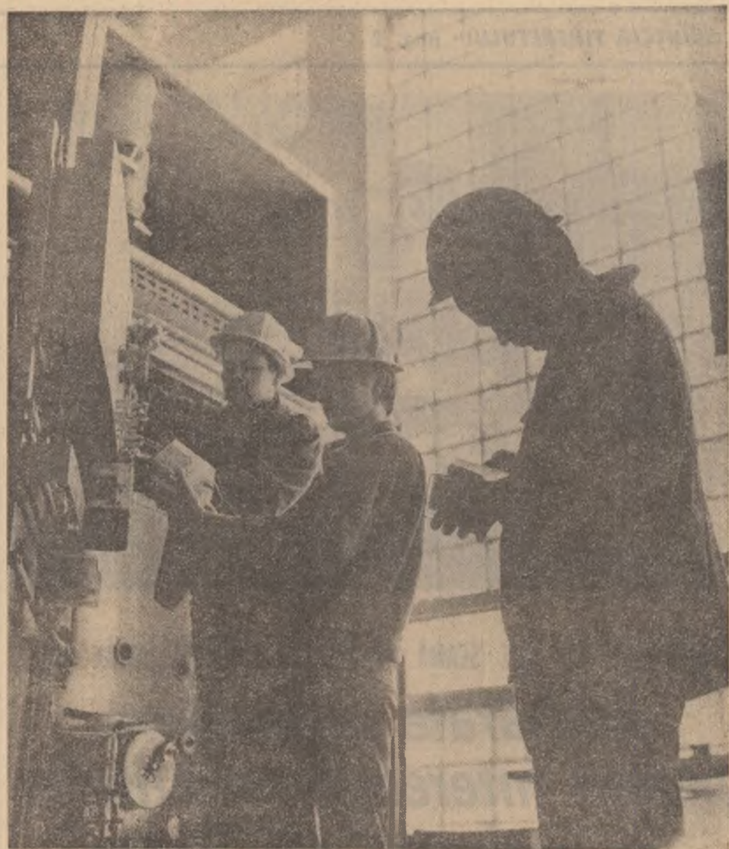
Elevii la Liceul energetic din Sibiu în timpul orelor de practică