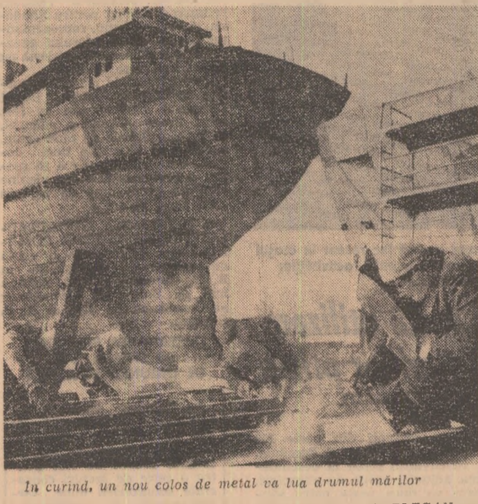
In curând, un nou colos de metal va lua drumul mărilor