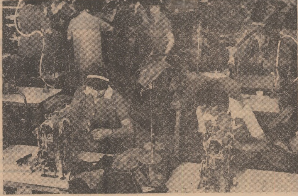
Printre tinerii muncitoare de la Intreprinderea de confecții din Tg. Secuiesc