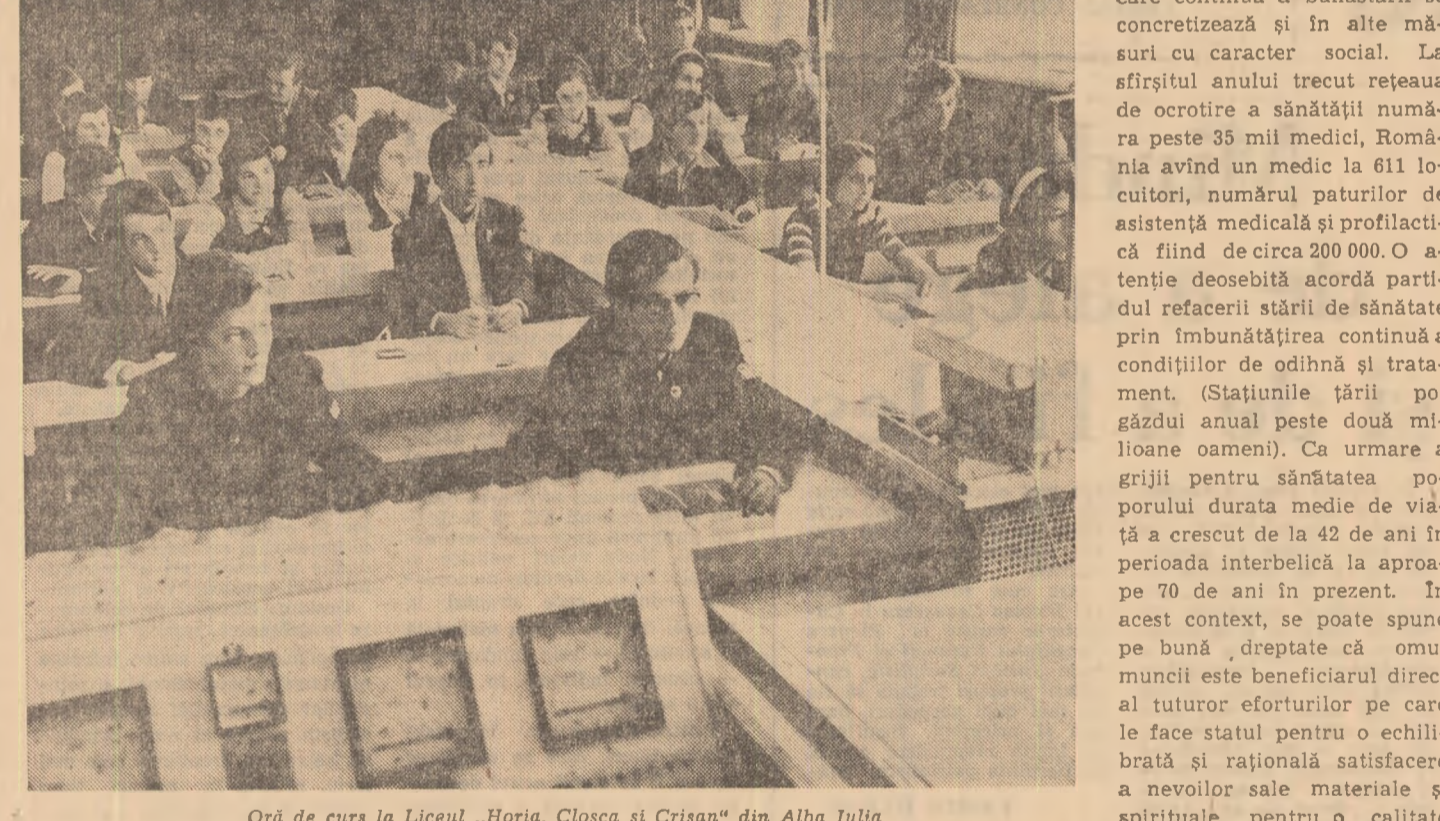
Oră de curs la Liceul „Horia, Cloșca și Crișan” din Alba Iulia