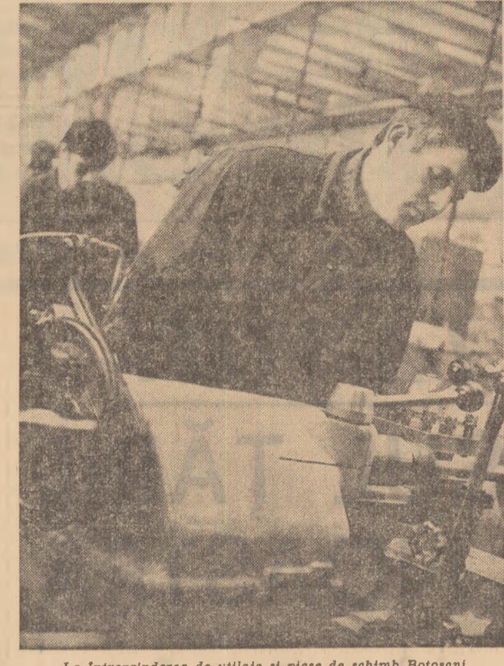
La întreprinderea de utilaje și piese de schimb Botoșani

urbanistică. Numai de la ultimele alegeri și pînă în prezent, fondul locativ s-a îmbogățit cu 3.000 de apartamente. Au fost date în folosință 40 de săli de clasă, aproape 700 de locuri în creșe și grădinițe, o casă de cultură și un dispensar medical urban, o sală de sporturi, spații comerciale însumînd peste 5.000 m.p. și alte obiective. Despre perspectivele de dezvoltare a municipiului în acest cîmp, s-a arătat că aici urmează să se construiască un spital cu 700 de paturi, un complex balneo-climateric, un cinematograful, noi unități școlare și un mare număr de locuințe. PRAHOVA, BUZĂU, DIMBOVIȚA. „Să facem din angajamentele noastre fapte concrete de muncă, să acționăm cu toată la mai bună gospodărire și înfrumusețare a localităților noastre, a fiecărei străzi și ulițe”. Sînt urmele pe care alegătorii din Prahova, Bu-