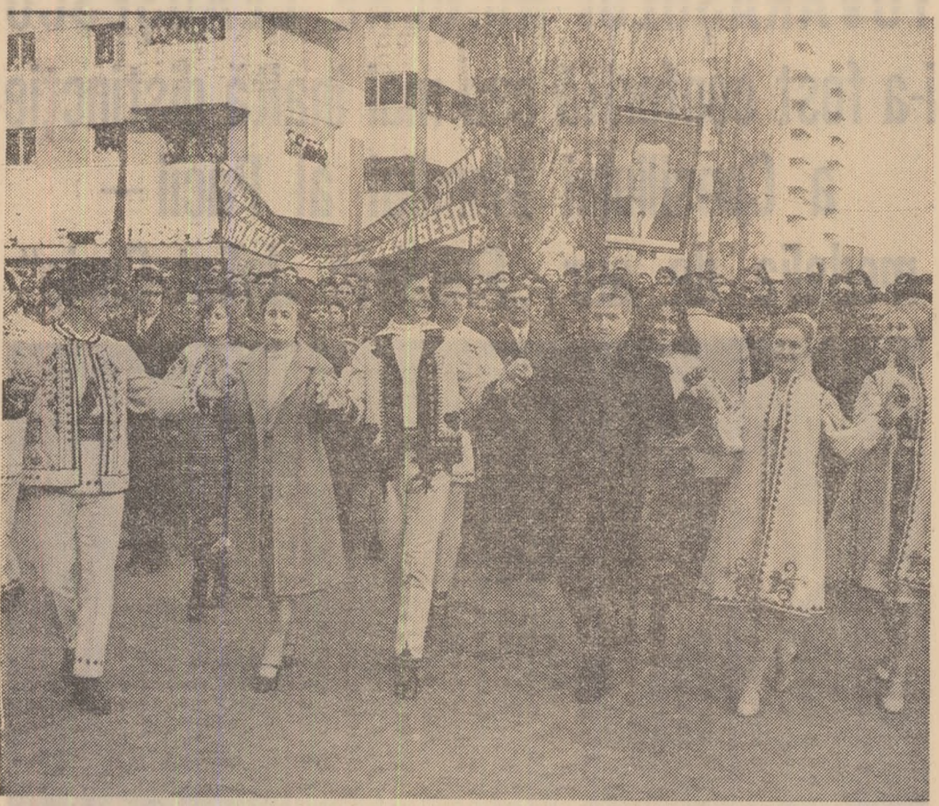
(Urmare din pag. 1) La ieșirea din secția de votare, secretarul general al partidului este salutat din nou, cu același entuziasm ca la sosirea, cu îndelungi ovacii și aplauze. Largul bulevard răsună de melodia cîntecului „Partidul, Ceaușescu, România” — alăturare firească a trei nume scumpe a întregii noastre națiuni, de ele fiind legate aspirațiile de mai bine ale întregului popor. Fi întoarcă numeroase ansambluri și formații artistice, fanfare, flintă mîile de locuitori ai acestui nou cartier al Bucureștiului, veniți în această dimineață de toamnă timpurie să-l salute din toată inima pe conducătorul partidului și statului nostru. Mulțimea scandează „Ceaușescu — P. C. R.”, „Ceaușescu și poporul”. Invitați de tineri și tinere, tovarășul Nicolae Ceaușescu, tovarăsa Elena Ceaușescu, ceilalți tovarăși din conducerea partidului și statului se prind în horă — simbol al unității și coeziunii întregului popor în jurul partidului, al conducerii sale. Tovarășul Nicolae Ceaușescu, tovarăsa Elena Ceaușescu

parcurs, apoi, pe jos, o bună parte a bulevardului Pantelimon, strălucit de blocuri moderne, împodobite în această zi de sărbătoare cu steagurile partidului și statului, cu covore multicolore, cu multe flori. Mii de cetățeni, aflați de-a lungul traseului, ieșiți la balcoanele impunctoarelor blocuri, fac secretarului general al partidului o caldă manifestare de dragoste, stimă și prețuire. Este o atmosferă de mare entuziasm și puternic optimism. Prin urale și ovacii puternice, bucureștenii își manifestă din nou satisfacția, marea bucurie de a participa, alături de întregul nostru popor — români, maghiari, germani și de alte naționalități —, în mod plener, prin votul dat în această zi candidaților Frontului Unității Socialiste, la făurirea destinelor patriei noastre. Ei își reînnoiesc angajamentul de a da actului politic de la 20 noiembrie valoarea hotărîrii lor nestrămutate de a înfăptui mărrețul Program al partidului de edificare a societății socialiste multilaterale dezvoltate și înaintare a României spre comunism.