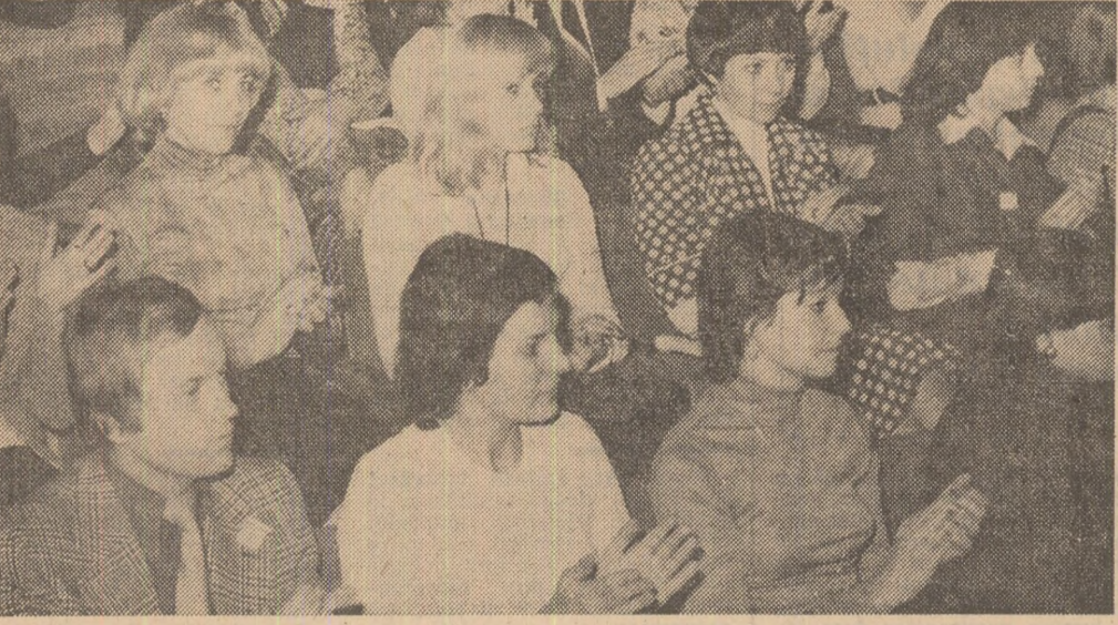
Aspect din timpul festivităților de deschidere a întâlnirii prietenești dintre reprezentanții ai tineretului român și ai tineretului cehoslovac

În după-amiaza aceleiași zile, la Clubul tehnic din Pitești, au început lucrările seminarului bilateral U.T.C.-U.S.T. pe probleme ale activității organizațiilor de tineret și șantierelor de construcții. Seara, ansamblul artistic al U.S.T. a prezentat un spectacol la Casa de cultură a orașului Curtea de Argeș.