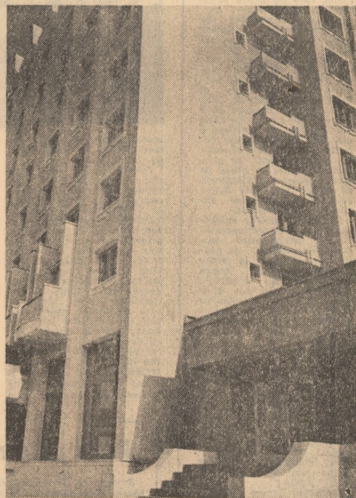
Noul hotel din Roman