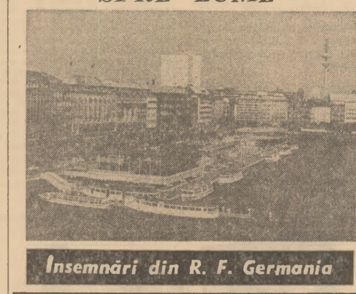
Insemnări din R. F. Germania