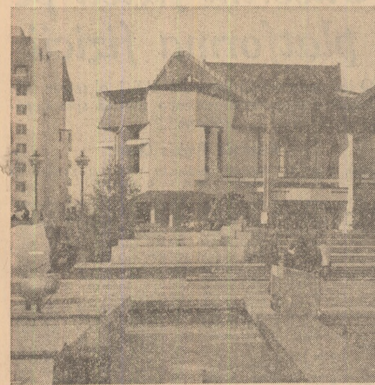
Imagine din Tg. Mureș