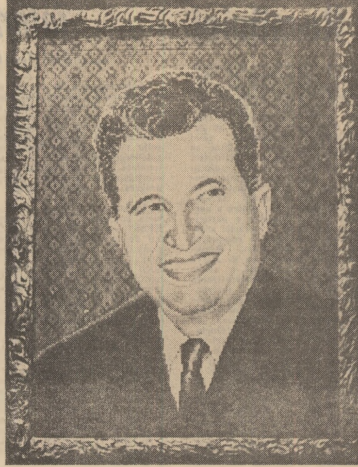
Din Expoziția omagială organizată la Muzeul de istorie al Republicii Socialiste România

și democratizare a vieții spirituale, precum și ceea ce „intemeierii” uriașei sărbători a arcei amatoare și profesionale care este Festivalul național „Cîntarea României”.