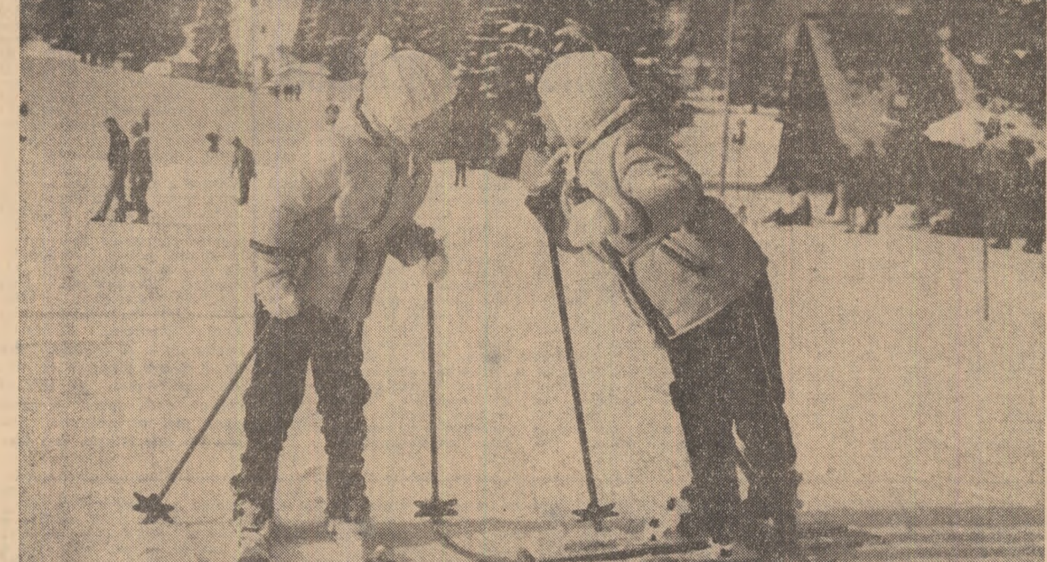
„Am auzit c-o să mai nîngă!”