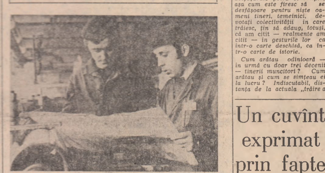
Scule de foraj de cea mai bună calitate — într-un angajament al tinerilor de la Întreprinderea mecanică Cimpina de mai mult timp...

CUVÎNTAREA TOVARĂȘULUI NICOLAE CEAUȘESCU la Plenara comună a consiliilor oamenilor muncii de naționalitate maghiară și germană 14 martie 1978.