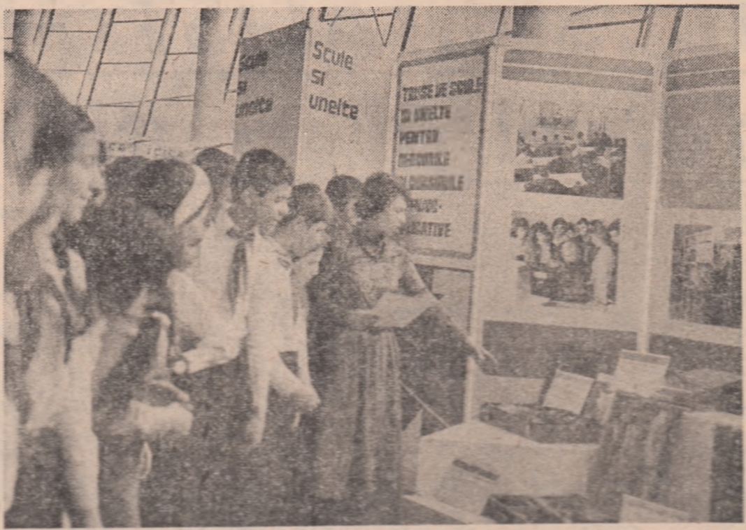
In fata expozitiilor realizate de colegii lor de gențerie — elevii Școlii generale 51. Un stil schimb de experiență și promisiunea că la viitorul „Săptămâna de știință și tehnică românească” se vor impune nume noi de inovatori.