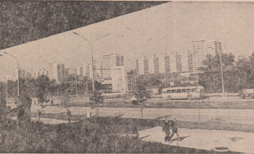
U.R.S.S. Unul din noile cartiere ale orașului Perm

Vineri a avut loc o sedință a Prezidiului R.S.F. Iugoslavia, în cadrul căreia au fost examinate aspecte privind activitatea internațională a Jugoslaviei și probleme ale actualității internaționale.