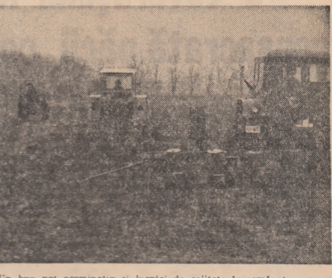
Un bus pe permisitate și lucrări de calitate la semănat — argumente hotărtoare pentru bogăția viitoarelor recolte