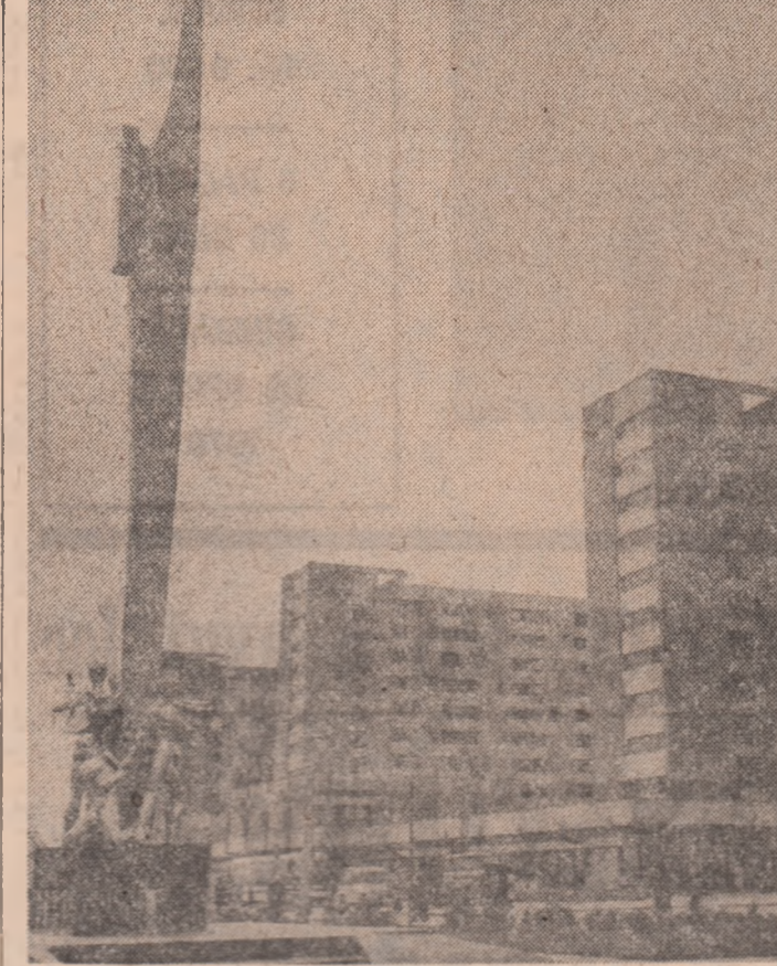
Construcții moderne în cartierul „CRIHALA“ din municipiul Drobeta-Turnu Severin