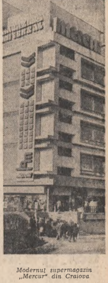
Modernul supermarket „Mercur” din Craiova.

În dezbaterea tinerilor, măsurile privind