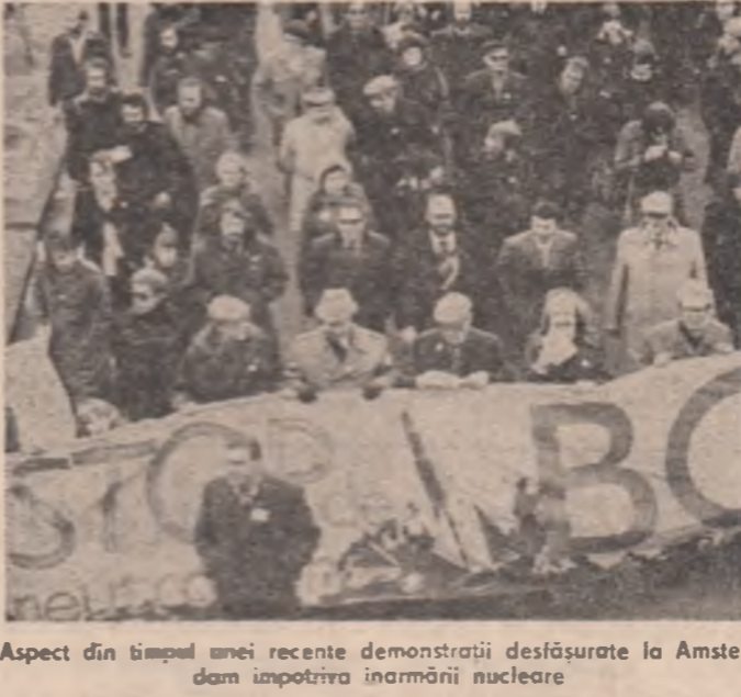
Aspect din timpul unei recente demonstrații desfășurate la Amsterdam împotriva înarmării nucleare