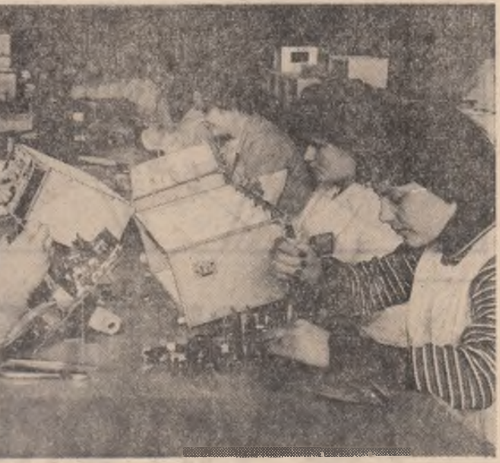
Calitatea — exigența muncii noastre de fiecare zi