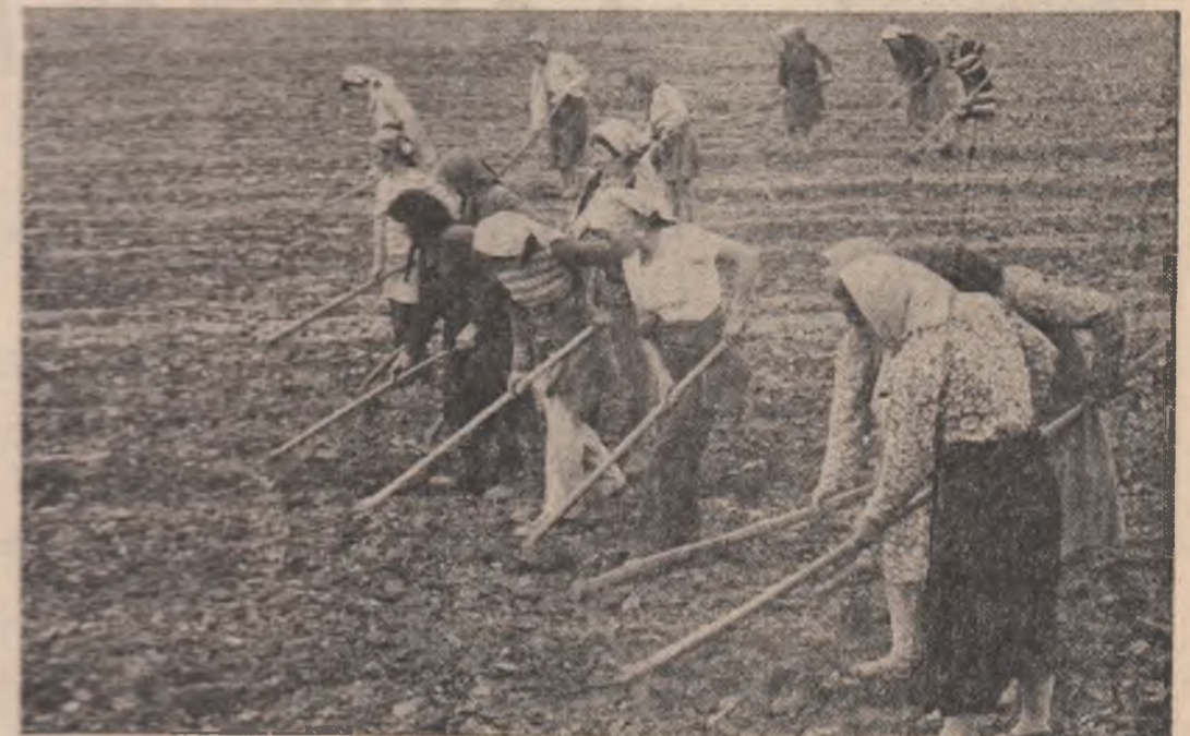
Alături de cooperatori și mecanizatori, tinerii satelor ialomițene răspund în număr mare sarcinilor prioritare în aceste zile