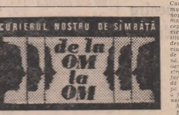
de Ioan Baieșu

cerut din nou scuze și mi-a cerut să ne împăcăm. Vă rugăm să nu vă amăniți oare mai merită să-l mai iert?