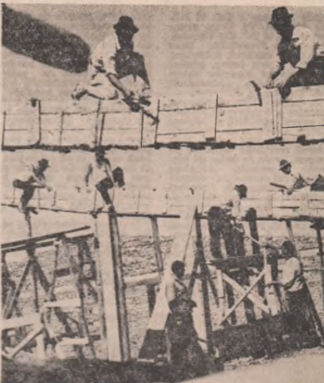
În sectorul zootehnic al C.A.P. Stoicănești-Olt se construiesc noi grajduri.