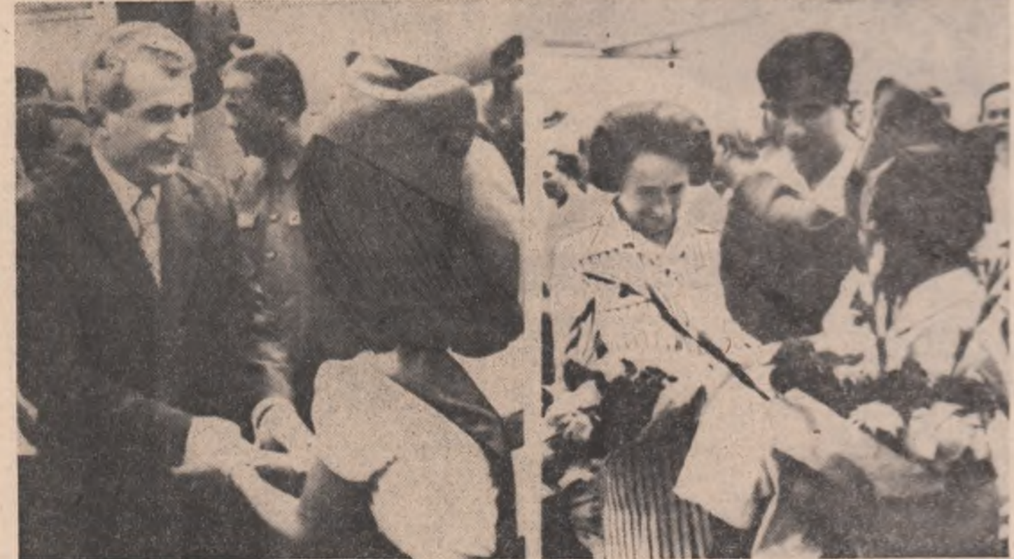
Calde manifestări de stimă și prețuire față de solii poporului român