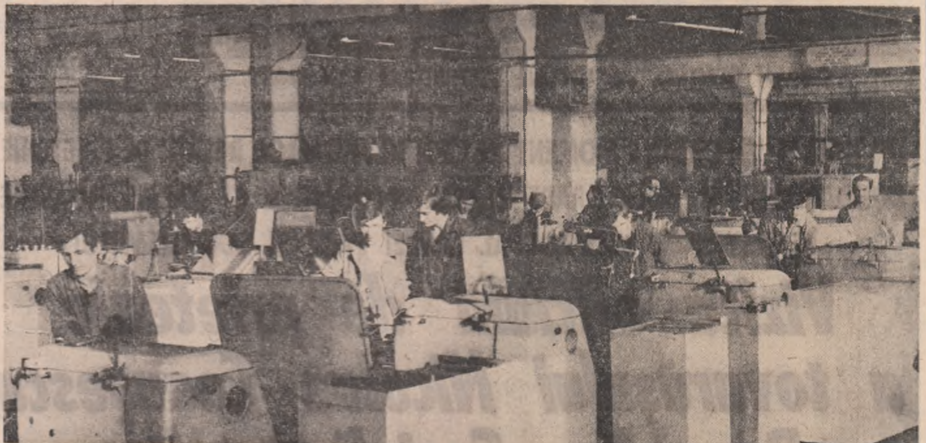
Flux tehnologic într-o modernă hală a întreprinderii SARO — Tirgoviste