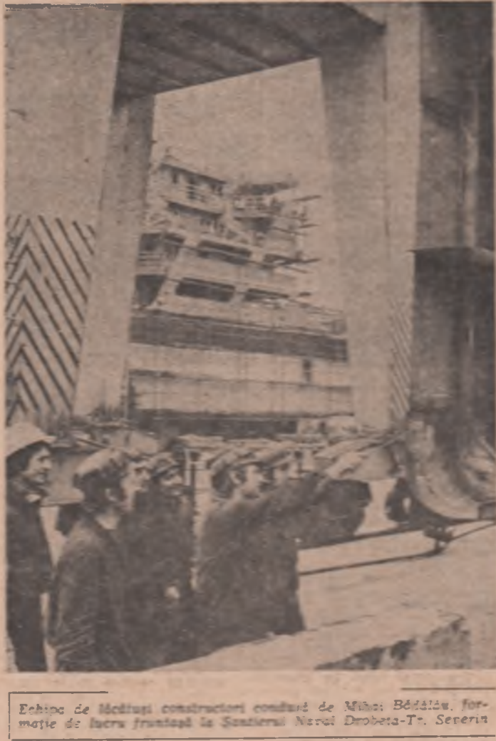
Edificiu de locuințe construit de constructorii din Mănaștilor. Serviciul de lucru prezintă la Șantierul Naval Drobeta-T. Severin