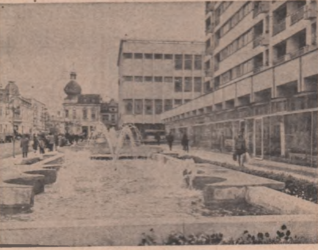
Construcții vechi și noi într-o îmbinare armonioasă la Tirgu Jiu