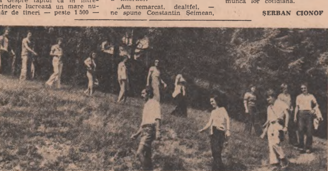
O invitație la drumeție, pentru sfîrșitul săptămîinii