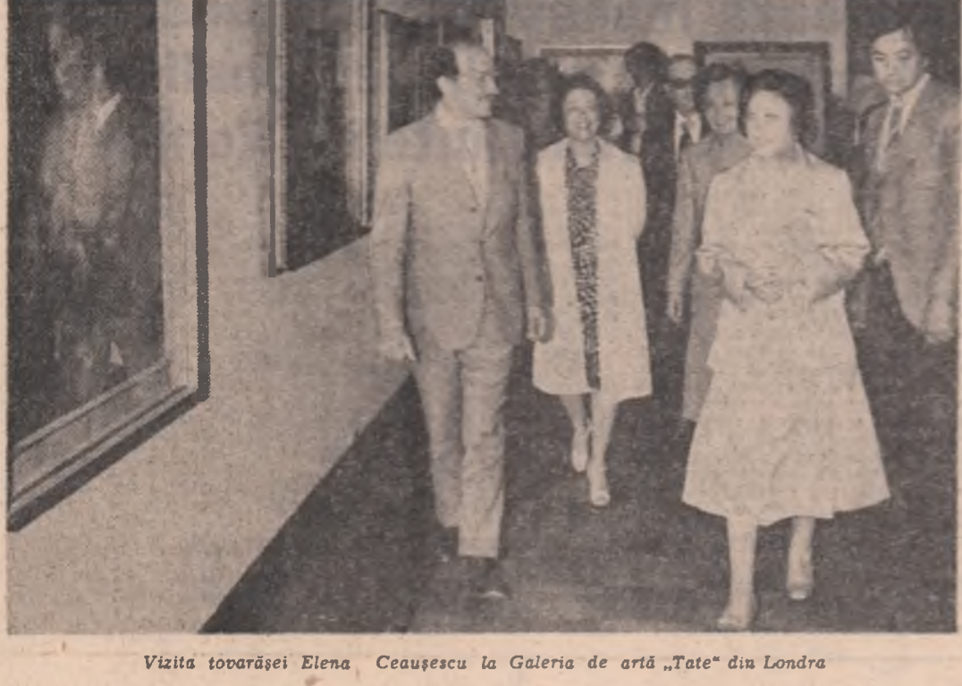
Vizita tovarășei Elena Ceaușescu la Galeria de artă „Tate” din Londra

TOVARĂȘEI ELENA CEAUȘESCU I-AU FOST CONFERITE ÎNALTE TITLURI ȘTIINȚIFICE