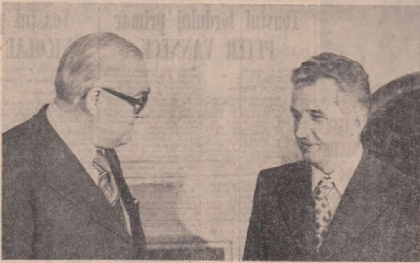
(Continuare în pag. 6 III-a)

Au fost examinate probleme importante privind stadiul și perspectivele relațiilor româno-britanice. Aprecindu-se evoluția favorabilă a raporturilor dintre cele două țări, a fost exprimată dorința comună de a extinde și aprofunda conlucrarea dintre România și Anglia în domeniile politice, economice, tehnico-stiințifice și culturale. S-a subliniat faptul că există largi posibilități de a amplifica și diversifica colaborarea reciproc avantajoasă dintre cele două state, stabilindu-se o serie de măsuri menite a asigura o evoluție fructuoasă rela-