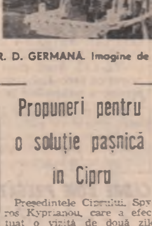
R. D. GERMANĂ. Imagine de la uzina de tractoare din Schönebeck

În continuare, au fost prezentate filmele „Independența, strălucită de vesucii a poporului român”, „România țara mea” și „România 77”. La sfârșitul manifestării, bibliotecii acestei școli i-au fost donate cărți românești de istorie și literatură.