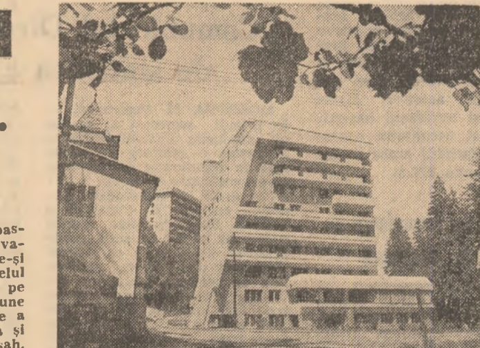
Stațiunea Slănic-Moldova, unul din locurile mult căutate în aceste zile de vară

Sfîntul Gheorghe se găsește în localitatea Sugaș-Băi (10 km depărtare) unde se găsește un parc zoologic, Băile Vilele (10 km) - cu edificii complexe pentru practica sportului și rezervatului natural „Mesteacănii” - Recl (12 km) - unde se pot face plimbări cu bărcile, întotdeauna pe scutul sportiv.