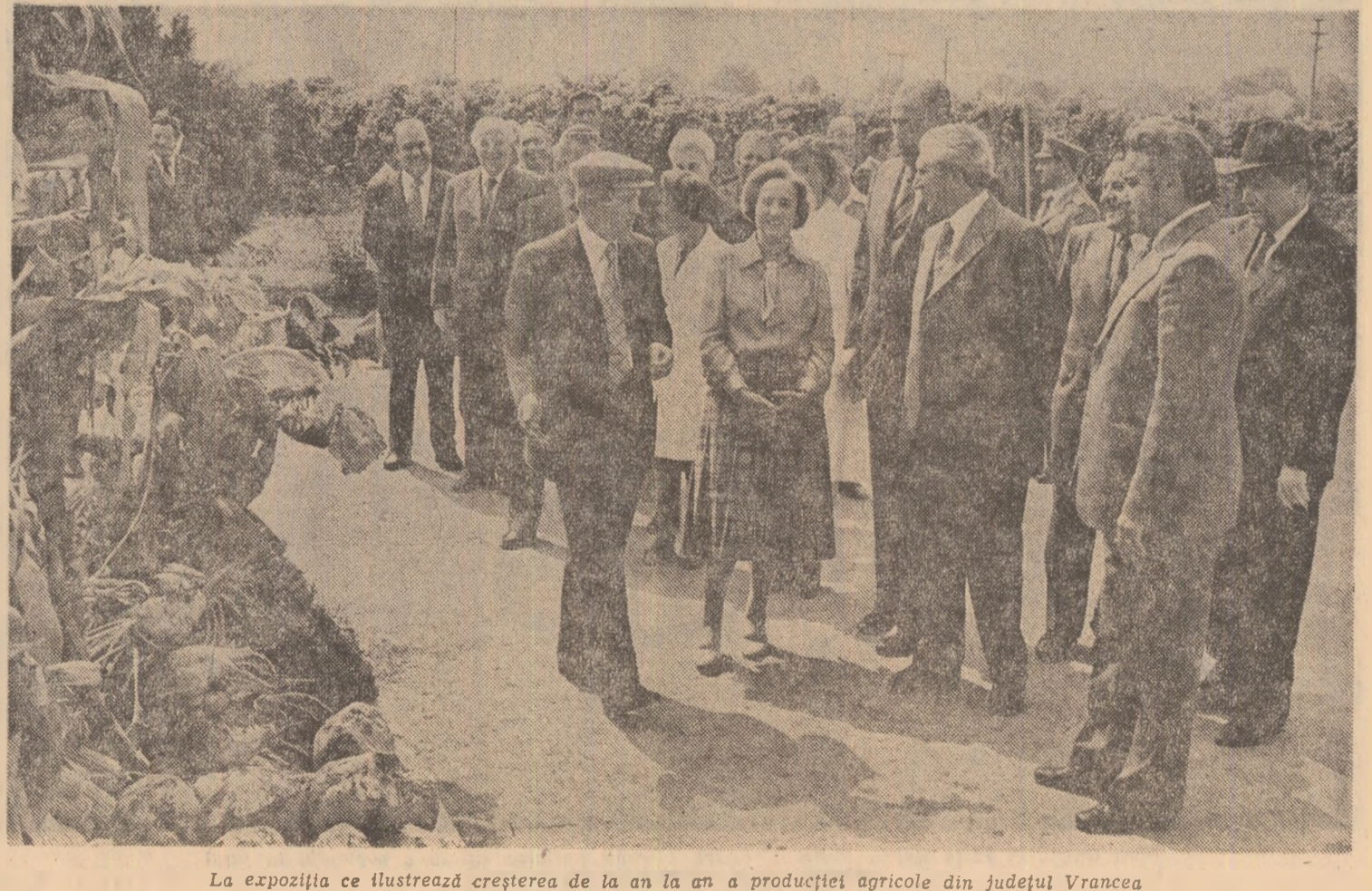
La expoziția ce ilustrează creșterea de la an la an a producției agricole din județul Vrancea