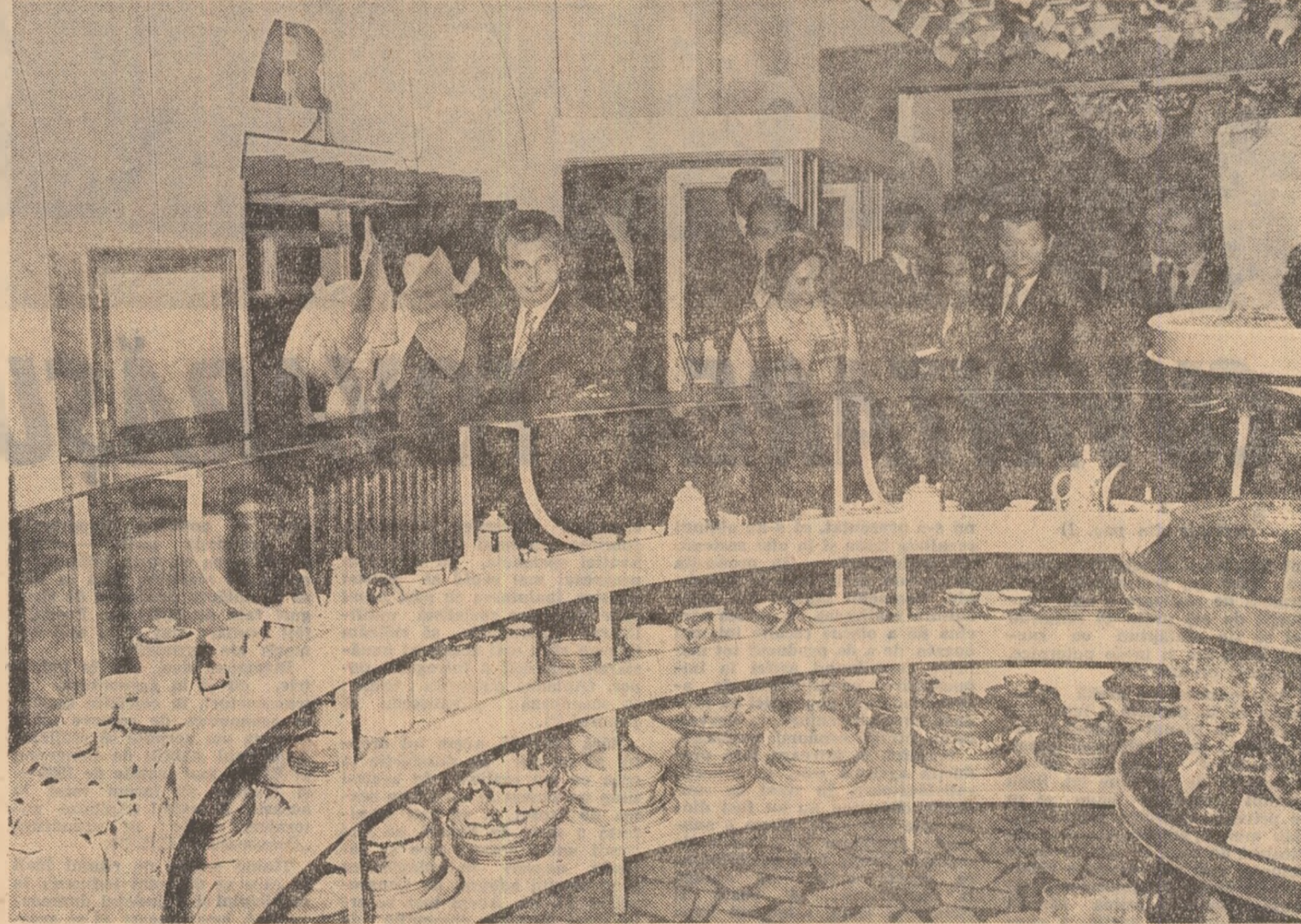
La magazinul „Romartina” este apreciată buna aprovizionare cu bunuri de larg consum care să răspundă puterii de cumpărare mereu crescînde a populației

Tovarășul Nicolae Ceaușescu și tovarășa Elena Ceaușescu au răspuns cu prietenie manifestărilor pline de căldură ale mulțimii.