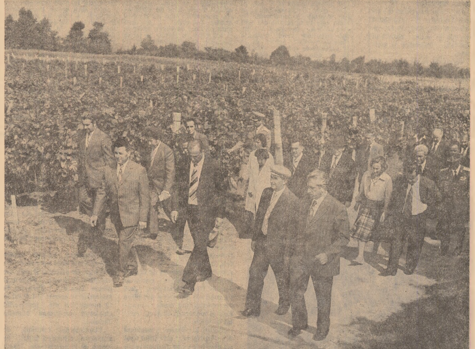
La întreprinderea agricolă de stat Odobești sînt apreciate eforturile făcute pentru modernizarea plantațiilor de vii, rodul bogat al acestei toamne