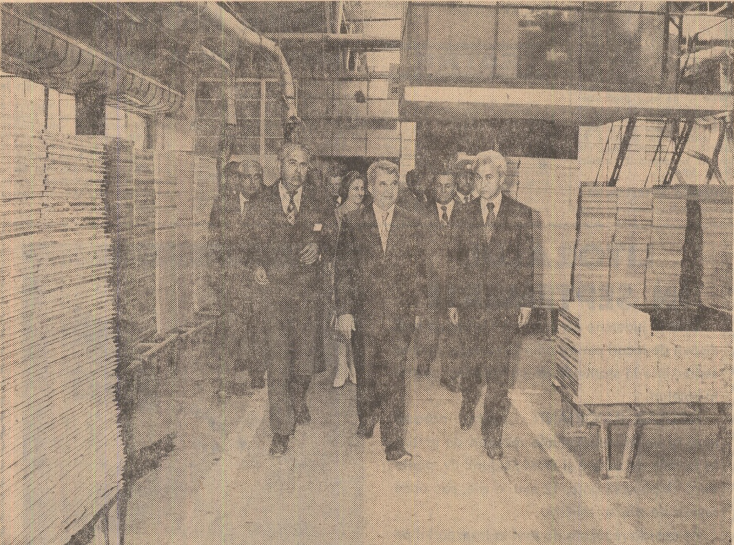
La Combinatul pentru prelucrarea lemnului, unde se valorifică superior bogățiile seculare ale Munților Vrancei și Putnei

Cu această convingere și cu această dorință, vă urez, din toată inima, succese tot mai mari în întreaga dumneavoastră activitate, multe satisfacții în toate domeniile, multă sănătate și ferice! (Aplauze și urale puternice, îndelungate. Într-o atmosferă de puternic entuziasm se scandează minute în șir „Ceaușescu — P.C.R.”, „Ceaușescu și poporul!”). Toți cei prezenți în marea plată a municipiului ovacionează puternic pentru Partidul Comunist Român, pentru Comitetul său Central, pentru secretarul general al partidului și președintele țării, tovarășul Nicolae Ceaușescu).