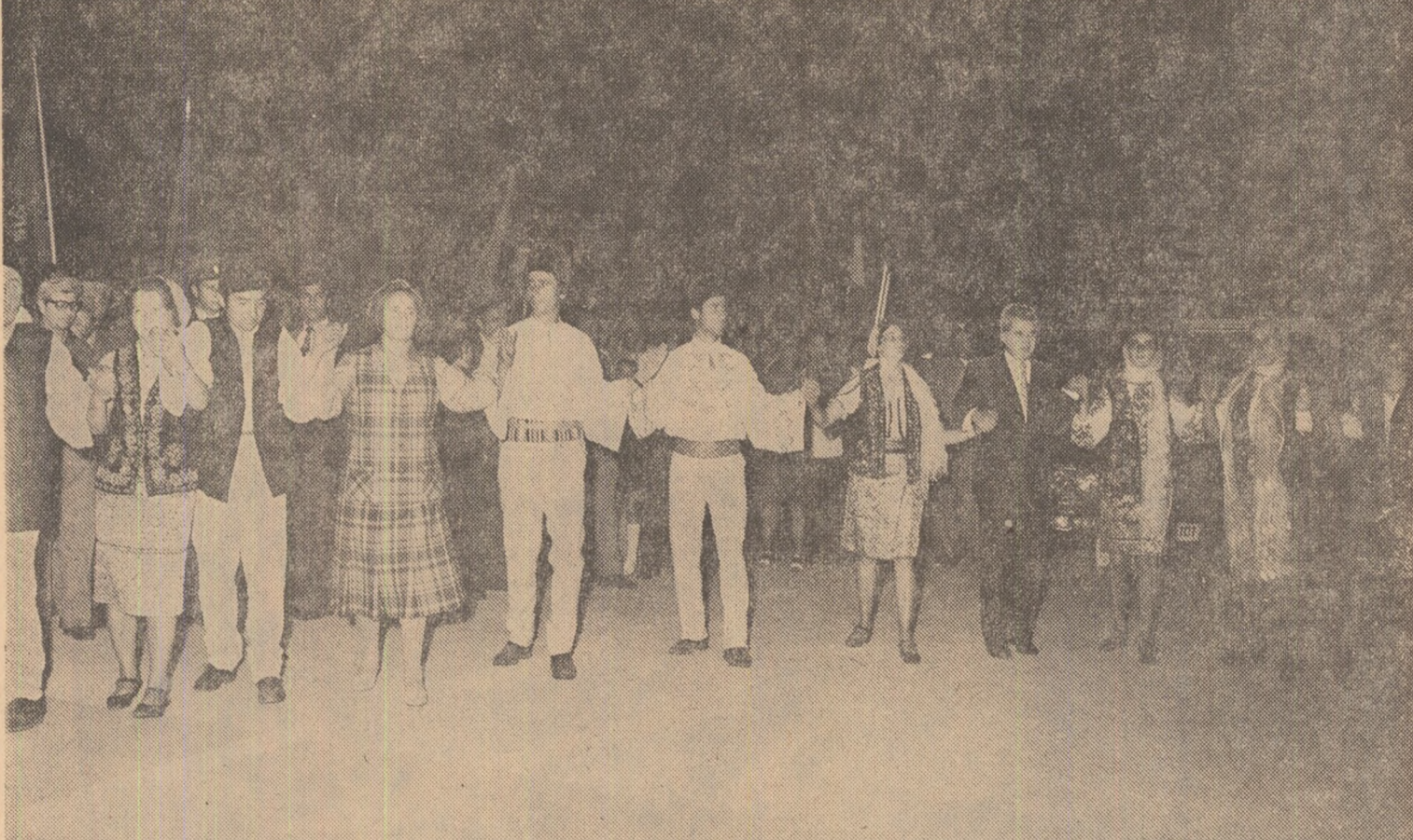
Hora Unirii, în Piața Unirii, ilustrînd astăzi vibrant unitatea strînsă a poporului în jurul partidului și al secretarului său general