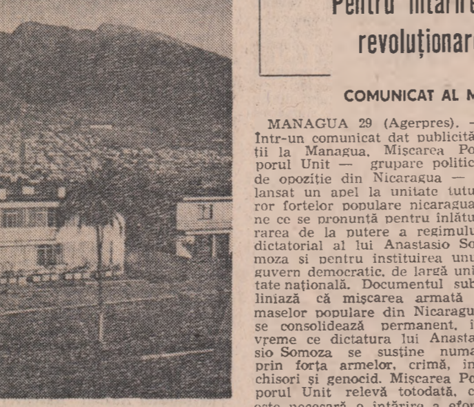
ECUADOR. Imagine din capitala ţării, Quito