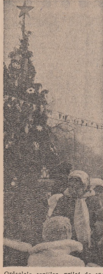
Orășelele copiilor, prilej de satisfacții și bucurii pentru cei mici