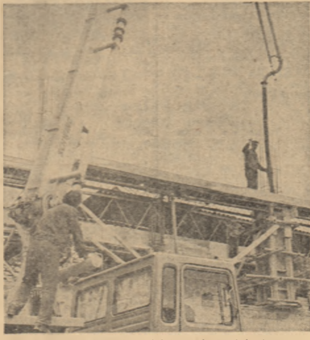
O nouă invenție în perimetrul întreprinderii: hala de motoare. Dincolo de apăsarea la adresa constructorului, hotărât să pună la timp în funcțiune noua capacitate, să subliniem încă un fapt: linia de agregate automatizate poartă un ritm de lucru de trei ori mai mare față de secțiile mai vechi, de același profil