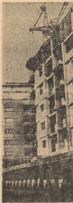
Construcorii bucuresteni lucreaza la noua fata a Căii Victoriei.

Refuzul categoric manifestat de neofascism fata de democratia burgheza vine din faptul ca aceasta e considerata ca fiind „pragul comunismului“.