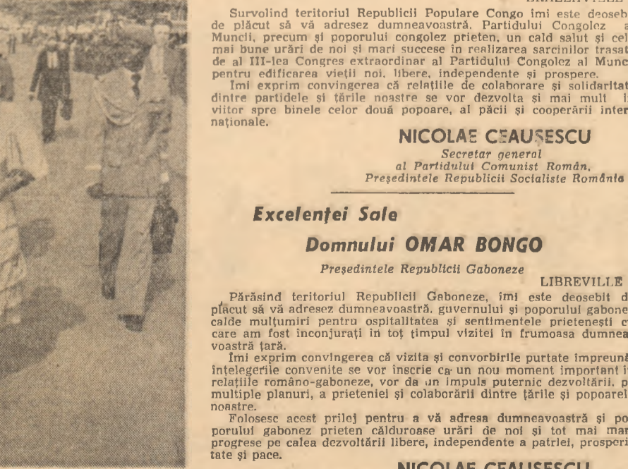
La plecarea din Libreville, pe Aeroportul internațional „Leon M'Ba”