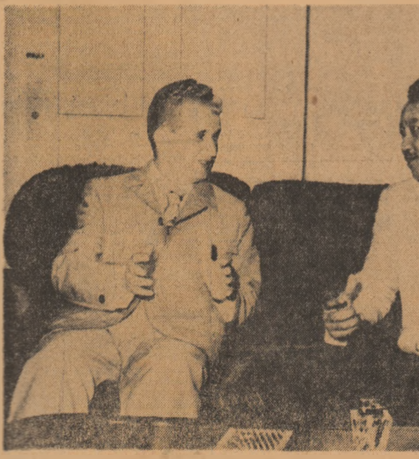
În paginile 2—3: ● Înminarea înalților oaspeți români a cheii orașului Khartoum ● Cuvîntul tovarășului Nicolae Ceaușescu rostit cu acest prilej ● Vizita la Muzcul Național al Sudanului ● Alte momente ale vizitei