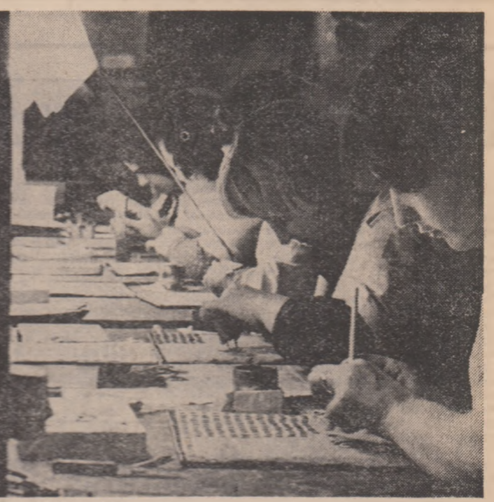
Clasa din care mai înainte erau numite la L.P.E.E. „Electro-Argeș” din Curtea de Argeș.