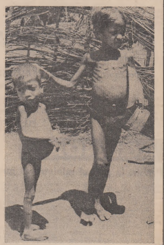
Acesta imagine a fost surprinsă pe pelicula undeva într-un sat indian. Dar fotografia ar fi putut fi realizată la fel de bine în peste o sută de țări din Africa, Asia sau America Latină