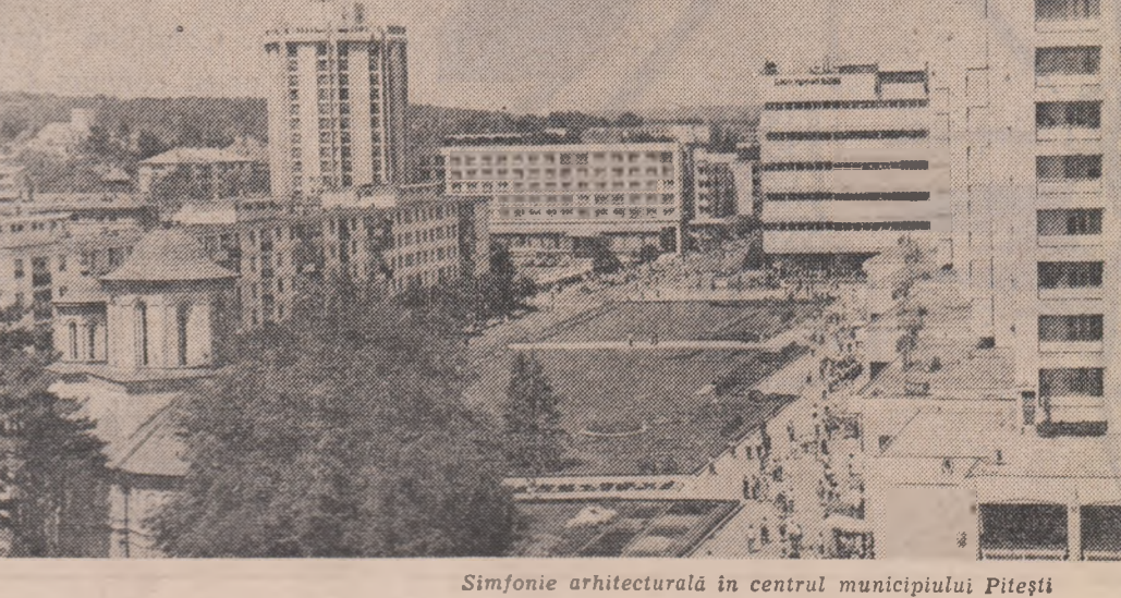
Simfonie arhitecturală în centrul municipiului Pitești