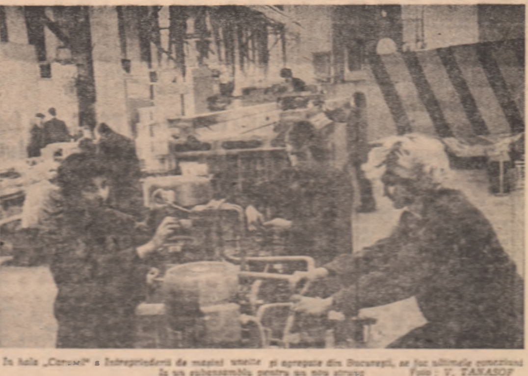
In sala „Carusel” a Intreprinderii de masini unelte...