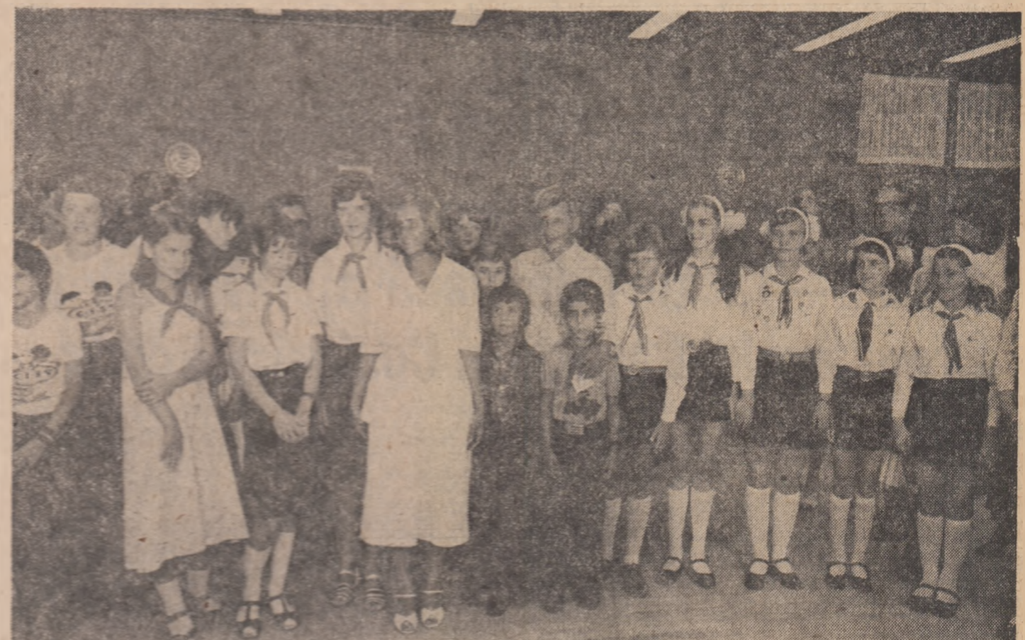
Tovarășul Nicolae Ceaușescu, președintele Republicii Socialiste România, și tovarășa Elena Ceaușescu au primit, ieri, în stațiunea Neptun, un grup de participanți la Festivalul internațional „Copiii lumii doresc pacea”, organiza-

Un cald omagiu președintelui României: „SĂ SE BUCURE COPIII ROMÂNI ȘI TOȚI COPIII LUMII DE UN ASEMENEA PRIETEN!”