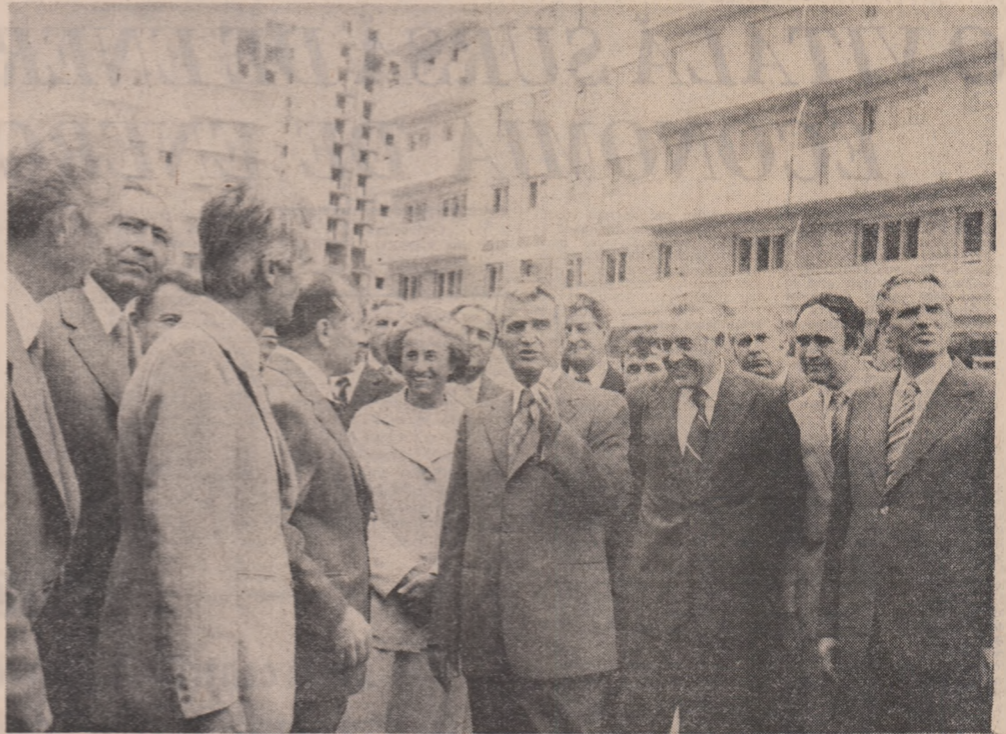
(Urmare din pag. 1)

al secretarului său general, în-gemare simbolică, ilustrând grațiar adinea prețuire a clasei