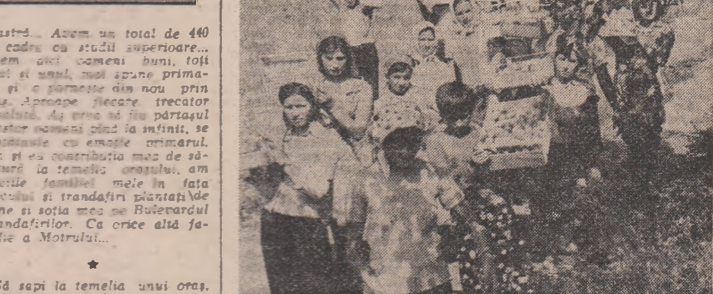
La culesul piersicilor