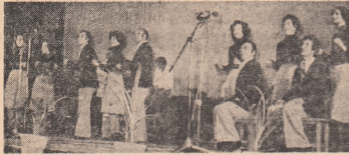
Brigada artistică a Combinatului de prelucrare a lemnului din Pitești

In municipiul Deva s-a desfășurat de curând etapa republicană a Festivalului național „Cîntarea României”, rezervată brigăzilor artistice, colectivelor de cântec și umor, formațiilor de estradă și muzică ușoară care, timp de 5 zile, au oferit spectacole satirico-umoristice de bună calitate, educative și incisive. Pe frumoasa scenă a casei de cultură s-au perindat 250 de formații și cîteva mii de artiști amatori aplaudați cu căldură de un public numeros și exigent, care umplea sala la orele 9 dimineața și o părăsea de-abia după miezul nopții. Ca membru al juriului, care n-a pierdut nici o sevență din cele 15 spectacole, maestrul oțelar hunedorean Ștefan Tripsa. Erou al Muncii Socialiste, a ris de nenumărate ori în hohote și a aplaudat frenetic, s-a bucurat de fiecare reușită, iar la cîte o replică mai usturătoare răminea îngîndurat și meditaiv.