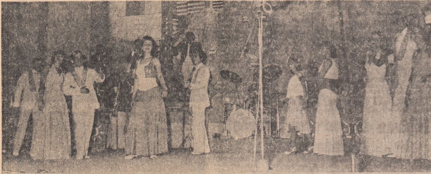
Estrada Casei de cultură din Deva

— Brigăzile și colectivele satirice s-au inspirat din realitățile cotidiene, sfericele întreprinderii sau orasului și acesta este, după părerea mea, un fapt laudabil. Rememorînd programele celor mai bune formații, am o imagine destul de clară a colectivelor din care fac parte, atât cu realizările, cît și cu umbrele lor. Fenomenele abordate sînt de o mare diversitate, au o identitate precisă. Mi se pare însă că în combaterea aspectelor negative există o anumită uniformitate, platitudine.