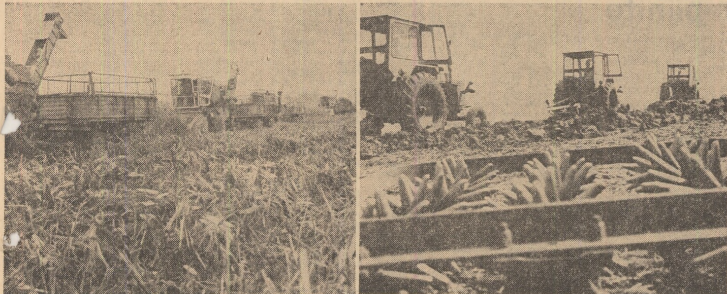
CU MIC CU MARE, LA STRINSUL LEGUMELOR

În județul Ilfov, cooperatorii, mecanizatorii, toți locuitorii satelor, între care foarte mulți tineri și elevi, desfășoară o intensă activitate pentru stringerea, transportul și depozitarea roadelor. Aflați în câteva puncte fierbinți din actuala campanie de toamnă, am surprins mai multe aspecte din care rezultă preocuparea permanentă a oamenilor, hărnicia cu care muncesc pentru ca nimic din recoltă să nu se piardă. Din păcate, nu peste tot am putut consemna aceeași stare a muncii.