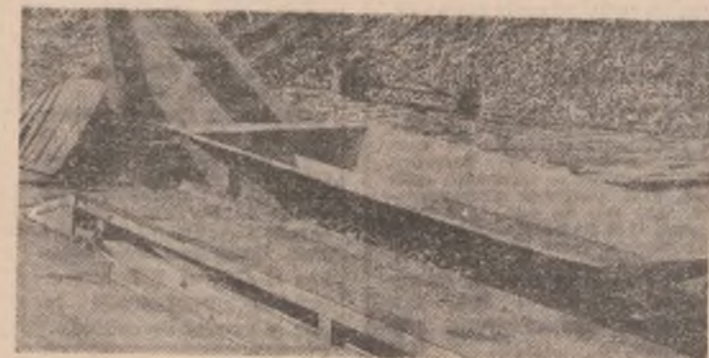
...pentru că utilajele din vecinătatea lor așteaptă să soscăcă din cîmp camioanele.