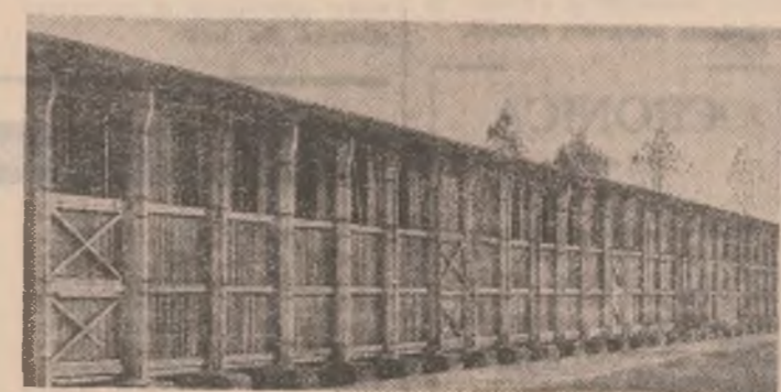
Aceste hambare cu o capacitate de 4000 tone stau deocamdată goale...

dispozite sînt insuficiente — o capacitate zilnică doar de 70-90 tone în loc de 120. Într-o autobusculeantă de 6,5 tone, prin construcție destinată materialelor cu greutate specifică mare, nu pot fi încărcate decît maximum 3 tone de porumb. Încășările le face însă la capacitatea înscrisă în planul de imatriculare (3) în plus, chiar și aceste mașini, odată trimise beneficiarilor, sînt apoi luate în afara oricărui griji privind asistența tehnică. Așa se face că soferul Petru Popovici, la ora 17, nu a făcut decît un singur transport deși distanța din cîmp pînă la bază nu este mai mare de 35 km, iar cîmpul sînt Iosif Gaspar nu a transportat nici un kilogram fiindcă mașina îi era defectă.