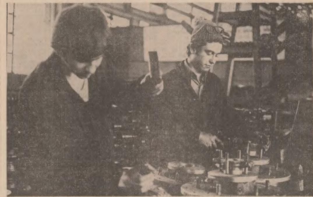
Aici, în secția de montaj unde produsele capătă forma finală, se văd roadele muncii întregului colectiv al întreprinderii de pompe „Aversa” din București