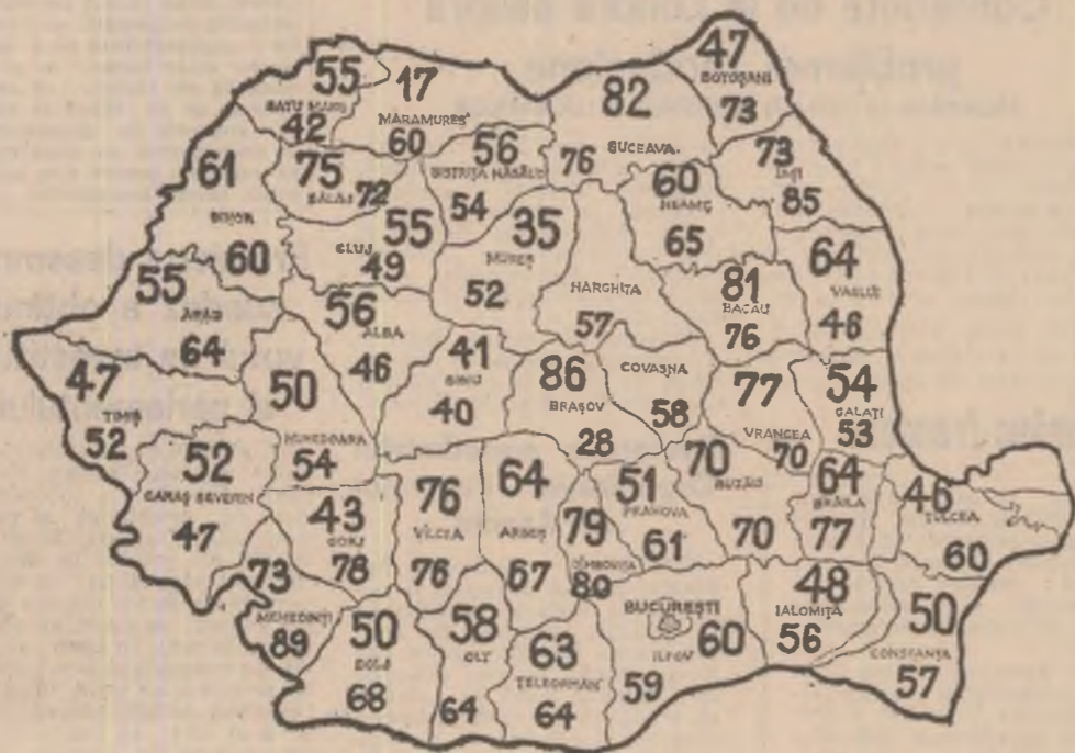
Cifra de sus reprezintă situația recoltării în I.A.S., cifra de jos cea din C.A.P.

SITUAȚIA RECOLTĂRII PORUMBULUI la data de 11 octombrie 1979 (în procente)