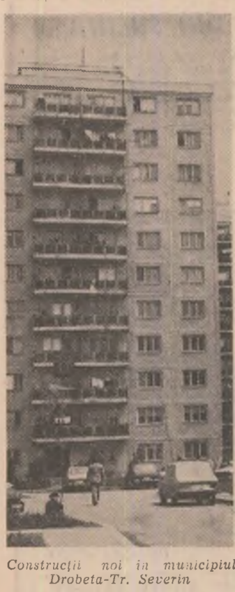
Construcții noi în municipiul Drobeta-Tr. Severin