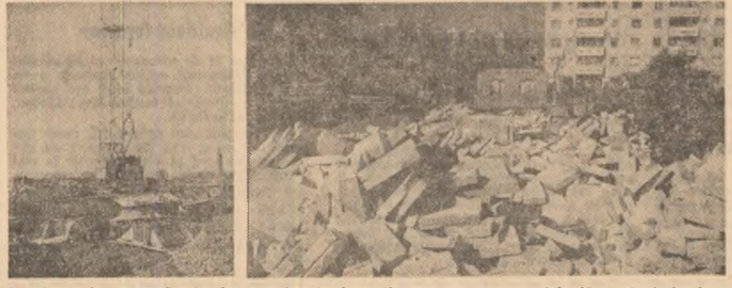
Imagini nedorite pe Șantierul nr. 1 din Arad: utilaje care stau, materiale lăsate la întimplare sau deteriorate.

În telegrama participanților la Conferința organizatorică municipală Roman se spune: Susținem din toată inima propunerea de la cel de-al XII-lea Congres, dumneavoastră, mult stimată și iubite tovarășe Nicolae Ceaulescu, să fiți reales în funcția de secretar general al partidului, aceasta constituind pentru noi, ca și pentru întregul partid și popor, garanția sigură a înalțării ferme a patriei pe drumul fâuririi socialismului și comunismului. Ne angajăm că, în cinstea congresului partidului, să înfăptuim angajamentul asumat de a realiza o producție suplimentară de 1,3 miliarde lei, că vom face totul pentru trudecerea în viață a istoricilor hotărîri pe care le va adopta marea forum al comuniștilor români.