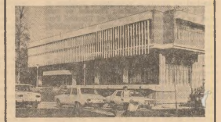
Stiaționa Buziaz sub semnul permanentelor înnoiri și al staționarității griji pentru sănătatea oamenilor muncii. Donată și această ultimă realizare: cantina noului complex de odihnă