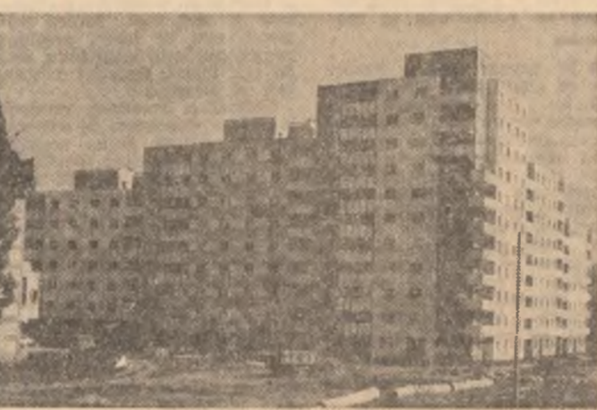
Noile blocuri construite pe malul Mureșului - o parte dintr-un viitor cartier cu 15.000 apartamente