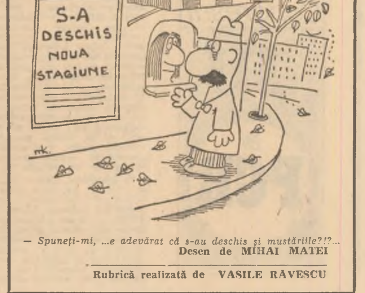
— Spuneți-mi, ...e adevărat că s-au deschis și mustățile?!? — Desen de MIHAI MATEI