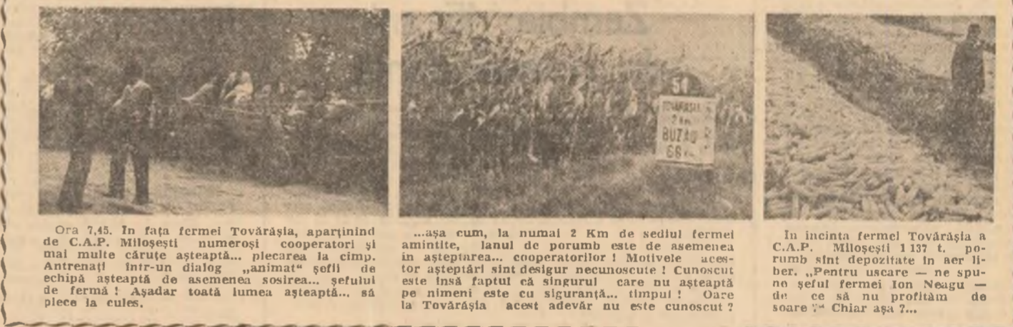
Ora 7.45. În fața fermei Tovărășia, aparținînd de C.A.P. Mîloșești, numeroși cooperatori și membri ai comitetului sunt în discuție...