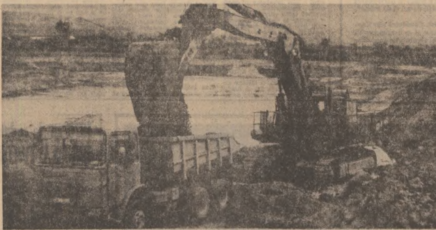
Ca de fiecare dată, în primul front al muncii — excavatoriștii și șoferii uriașelor autobasculante!

ACTIUNI CONCRETE, SPIRIT REVOLUȚIONAR ÎN DEZBATEREA ȘI ÎNSUȘIREA TEMEIICĂ A PROIECTELOR DE DOCUMENTE ALE CONGRESULUI AL XII-LEA AL PARTIDULUI