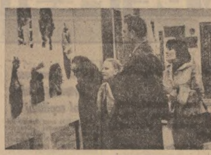
Prilej de recreere și îmbogățire spirituală